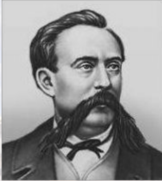
Николай Николаевич Зинин

русский химик, академик Петербургской академии наук, синтезировал анилиновые красители на основе сернистого аммония, что позволило получать красители в промышленных масштабах