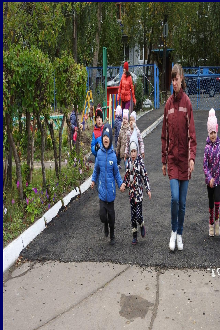
Кросс с родителями «Во имя мира»