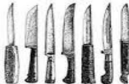
Ножи, предъявленные для опознания

Самостоятельное следственное действие, задачей которого является предоставление возможности лицу опознать, узнать среди предъявляемых ему людей, вещей или иных объектов тот, который он наблюдал или знал ранее.