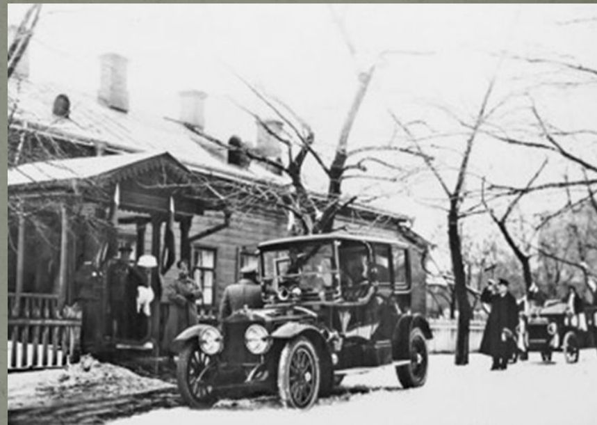
Николай II после посещения лазарета в Воронеже 6 декабря 1914 г