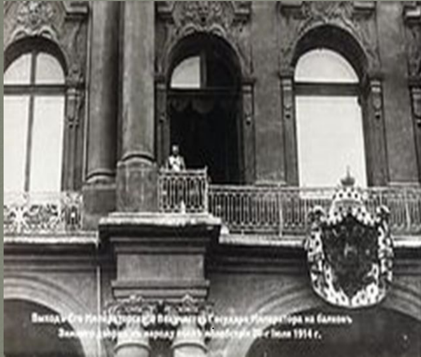
Выход в Зимний дворец в Вильнусу Констанца Романова на балкон Зимнего дворца в Петербурге 30 июля 1914 г.

Николай II объявляет войну Германии с балкона Зимнего дворца