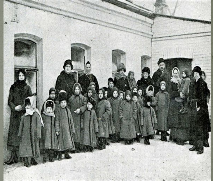
Воронежские педагоги содержали приют для детей- беженцев

Главноуполномоченным по устройству беженцев был назначен ректор СХИ К. Д. Глинка. При Воронежском сельскохозяйственном институте возникла организация из профессорско-преподавательского состава – Комитет по регистрации и устройству беженцев при сельскохозяйственном институте.