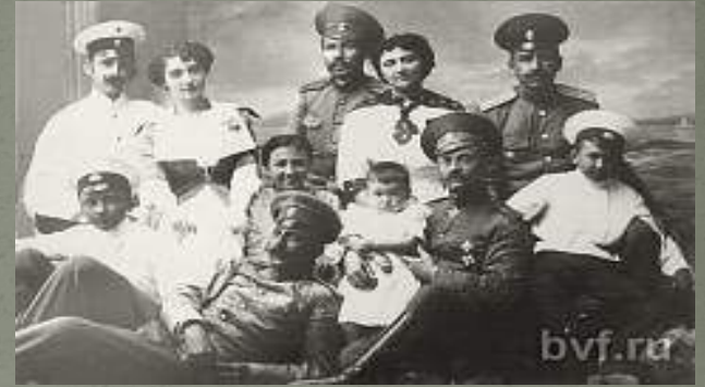
Офицеры 124-го пехотного Воронежского полка с семьями

Своё родословие 124-й Воронежский пехотный полк ведёт с 1775 года, когда были сформированы два Сибирских егерских батальона, из которых в 1796 году был выделен 19-й Егерский батальон, развёрнутый в 1801 году в 18-й Егерский полк, официально считающийся родоначальником Воронежского пехотного полка. Немало испытаний, подвигов и славы выпало на долю его солдат и офицеров. Их мужество и героизм на поле брани были образцом для многих.