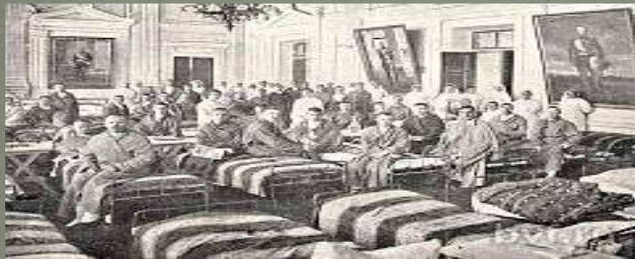
Госпиталь Воронежской общепедагогической организации. Палата №1

Тогда в своём дневнике он отметил, что в Воронеже хорошее состояние госпиталей.