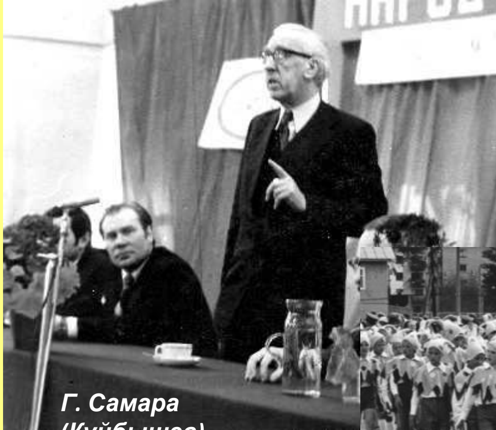
Г. Самара (Куйбышев)