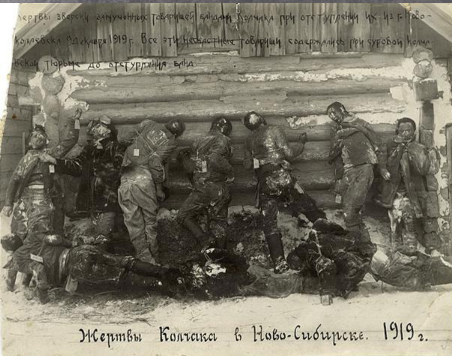
Жертвы Колцака в Ново-Сибирске. 1919 г.