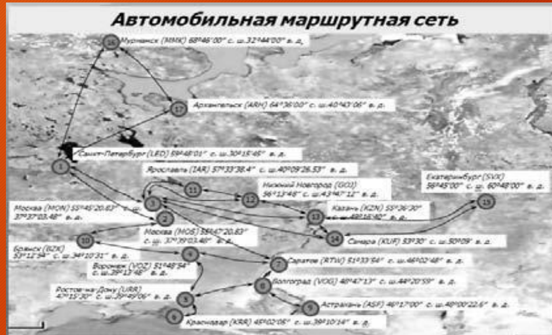
Рисунок 1. Пример автомобильной маршрутной сети.

Транспортно-терминальная сеть компании — это множество узлов и соединяющих их дуг. Узлами сети являются ее терминалы, дугами — маршруты перевозок, связывающие два терминала. Узлы представляют собой дистрибуционные центры, на которых осуществляются перевалка и сортировка грузов по направлениям перевозки.