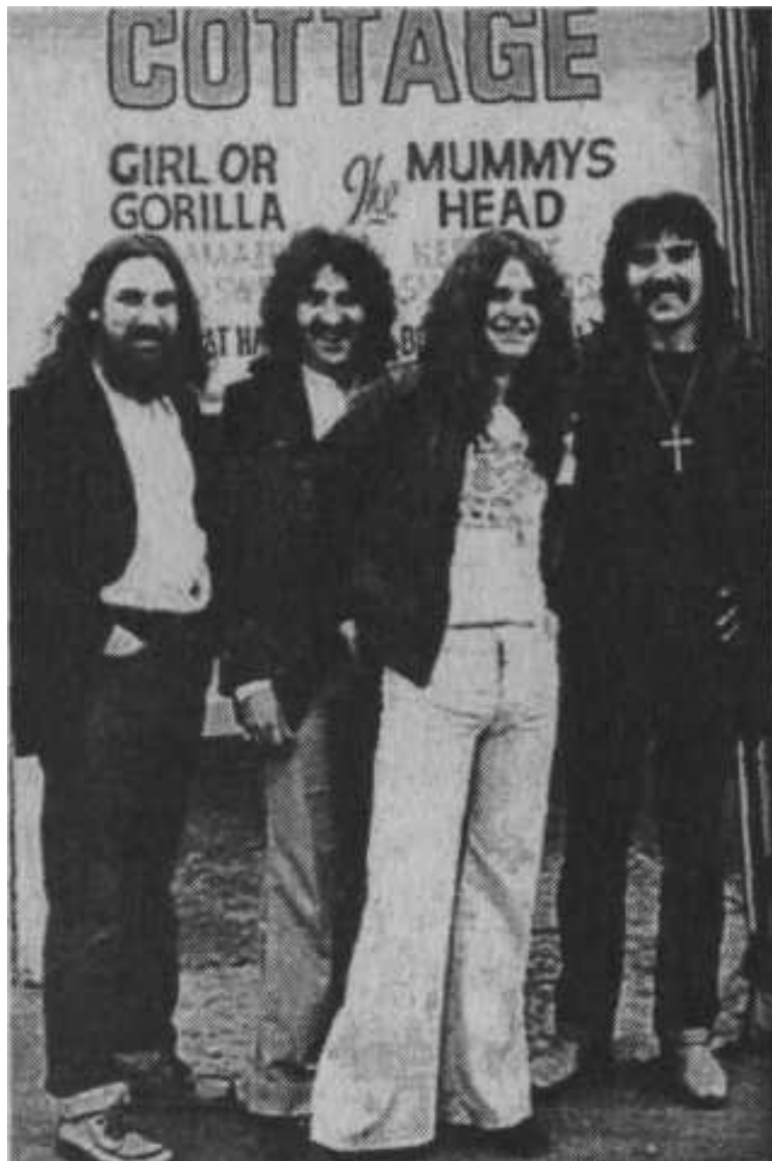
Ранний состав Black Sabbath

Приблизительно в то же время в рамках хард-рока стали появляться и стилевые разновидности, обладавшие некоторой долей самостоятельности.