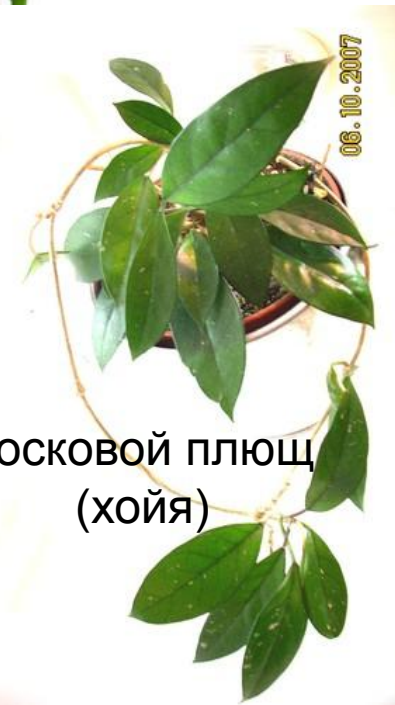
восковой плющ (хойя)