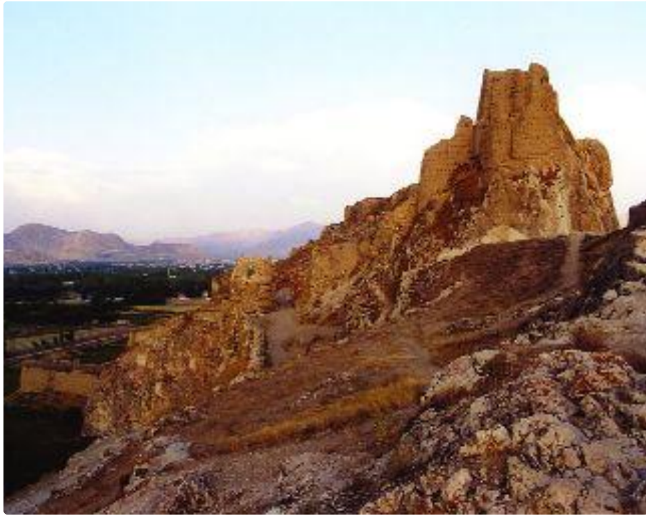
Վանի (Տուլշապա) միջնաբերդը