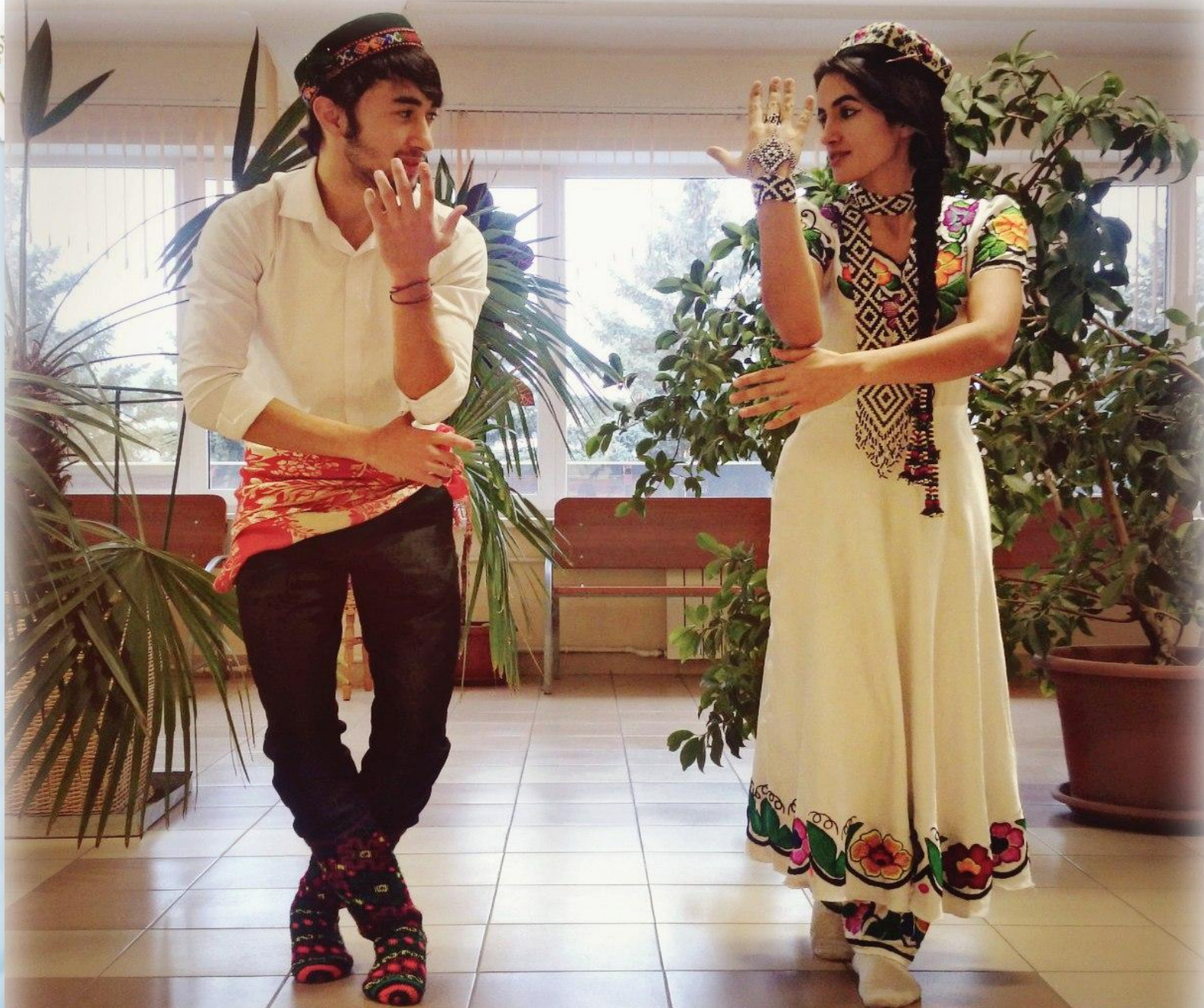
фотографии готового народного костюма