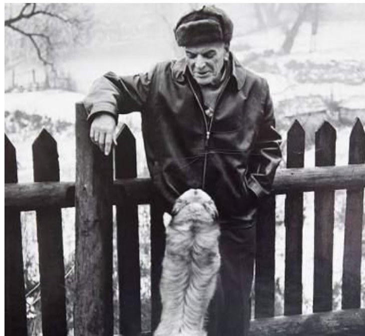
К. Паустовский с собакой Грозный