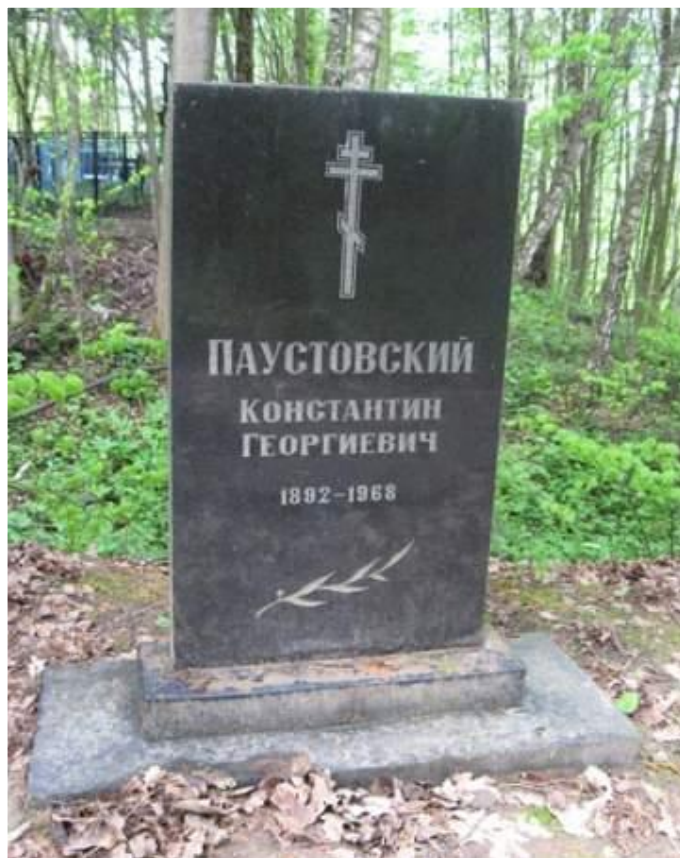
Могила К. Паустовского в Тарусе

Паустовский скончался в Москве в 1968 году, 14 июля. Однако он был похоронен на кладбище в Тарусе.