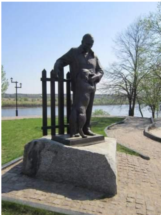
Памятник К. Паустовскому в Тарусе