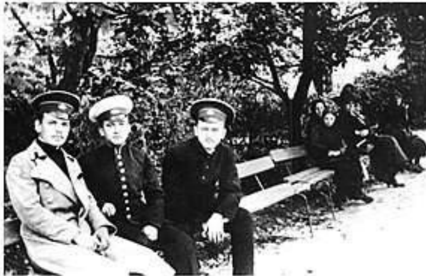
Гимназист К. Паустовский (крайний слева) с друзьями

Будущий писатель получил среднее образование в знаменитой Первой Киевской гимназии, из которой вышли многие учёные, конструкторы, литераторы и философы.