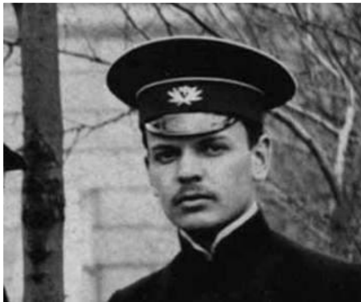
Гимназист К. Паустовский

Во времена учёбы в гимназии Паустовский пишет свой первый рассказ «На воде» и публикует в киевском журнале «Огни».