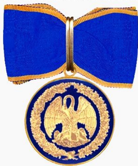
Знак отличия «За благодеяние»