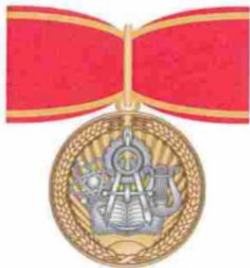
Знак отличия «За наставничество»