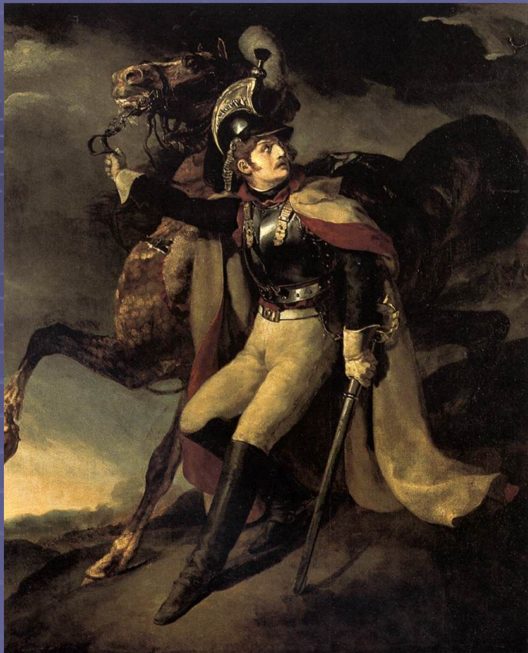
Раненый кирасир покидает поле боя" - 1814