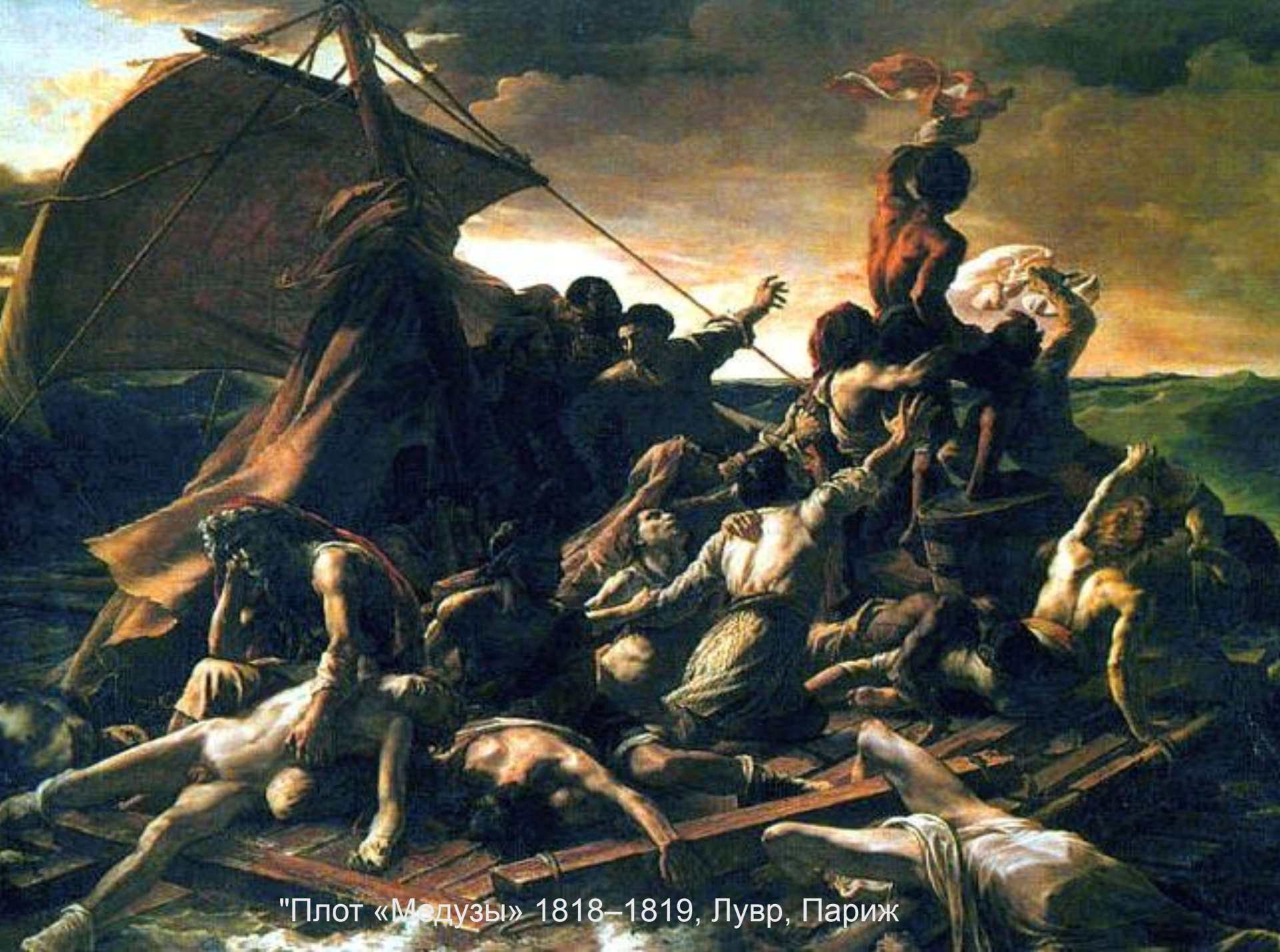
"Плот «Медузы» 1818–1819, Лувр, Париж