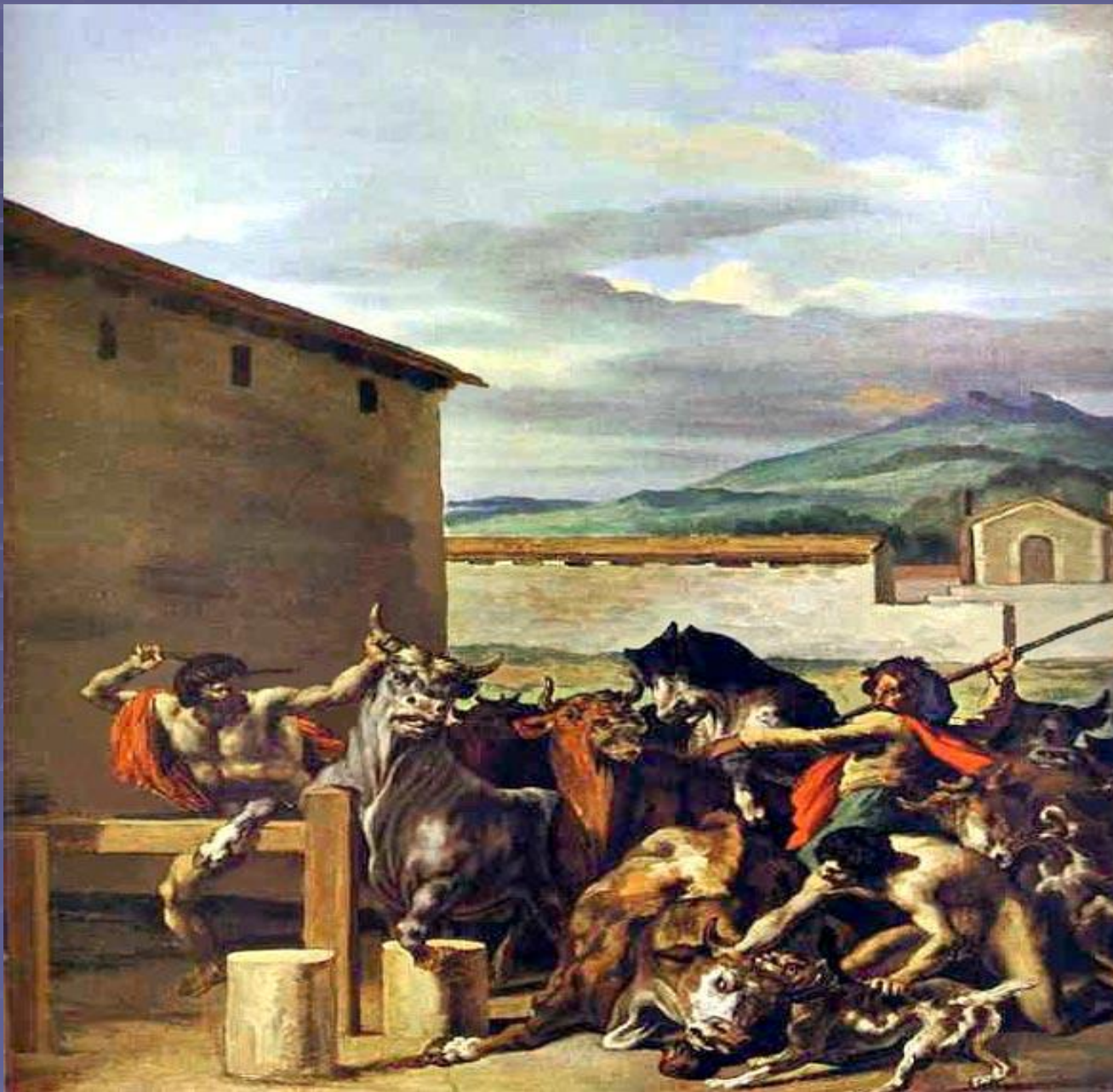
"Укрощение быков» 1817, Частное собрание