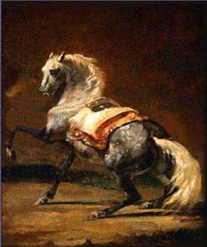
"Серая в яблоках лошадь" 1820