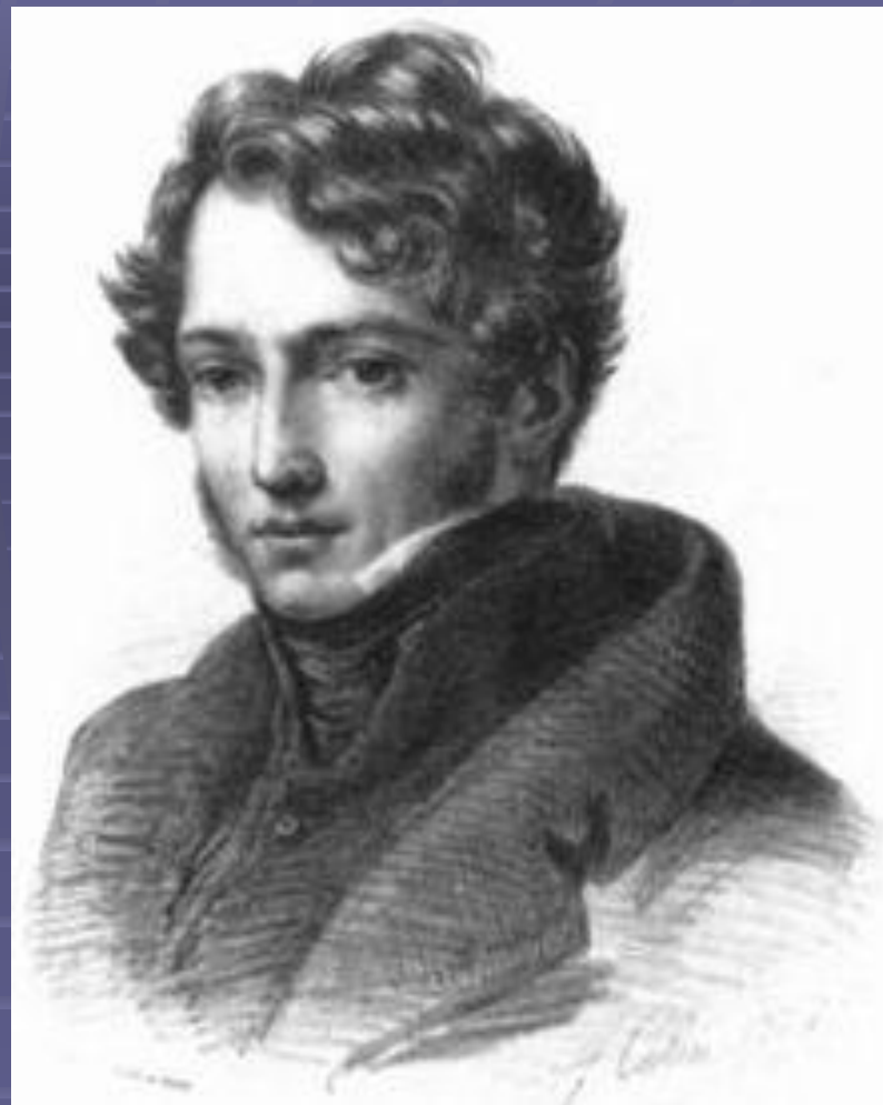
Жерико Теодор (1791–1824), французский живописец и график.

Теодор Жерико первым во французской живописи выразил свойственное романтизму острое чувство конфликтности мира, стремление к воплощению драматических явлений современности и сильных страстей.