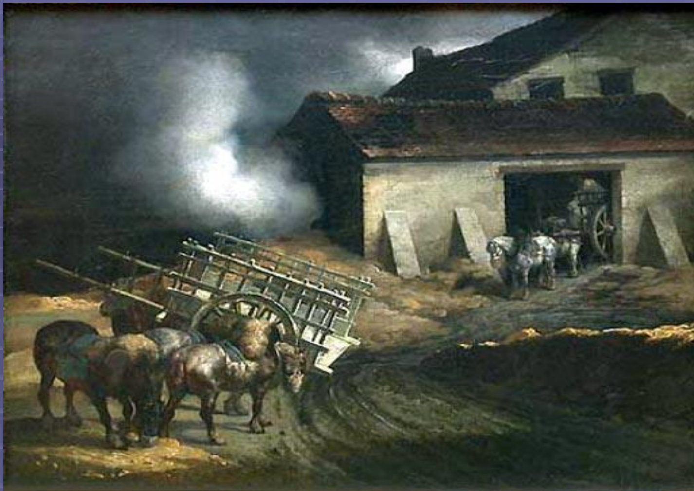
"Печь для обжига извести" 1822