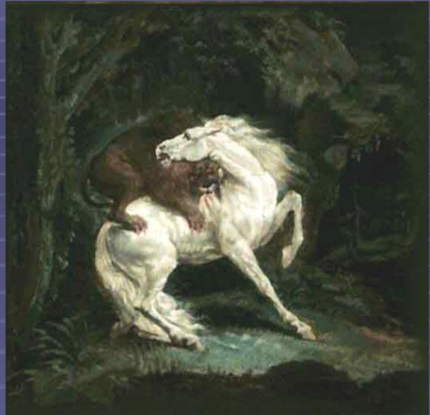
"Лошадь, терзаемая львом" 1822