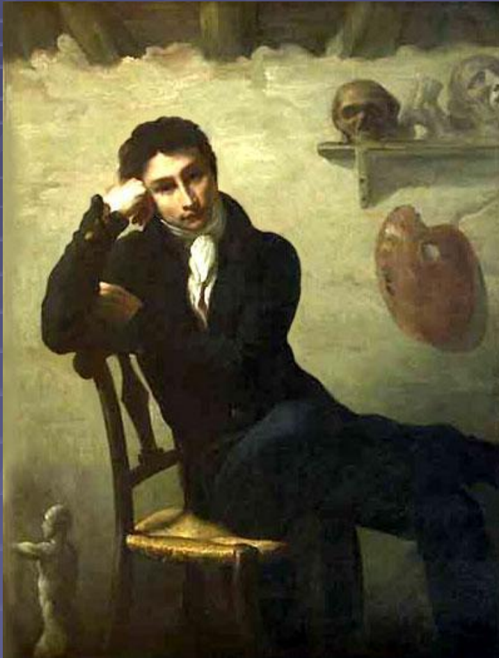
"Портрет артиста в его гримерной" 1823