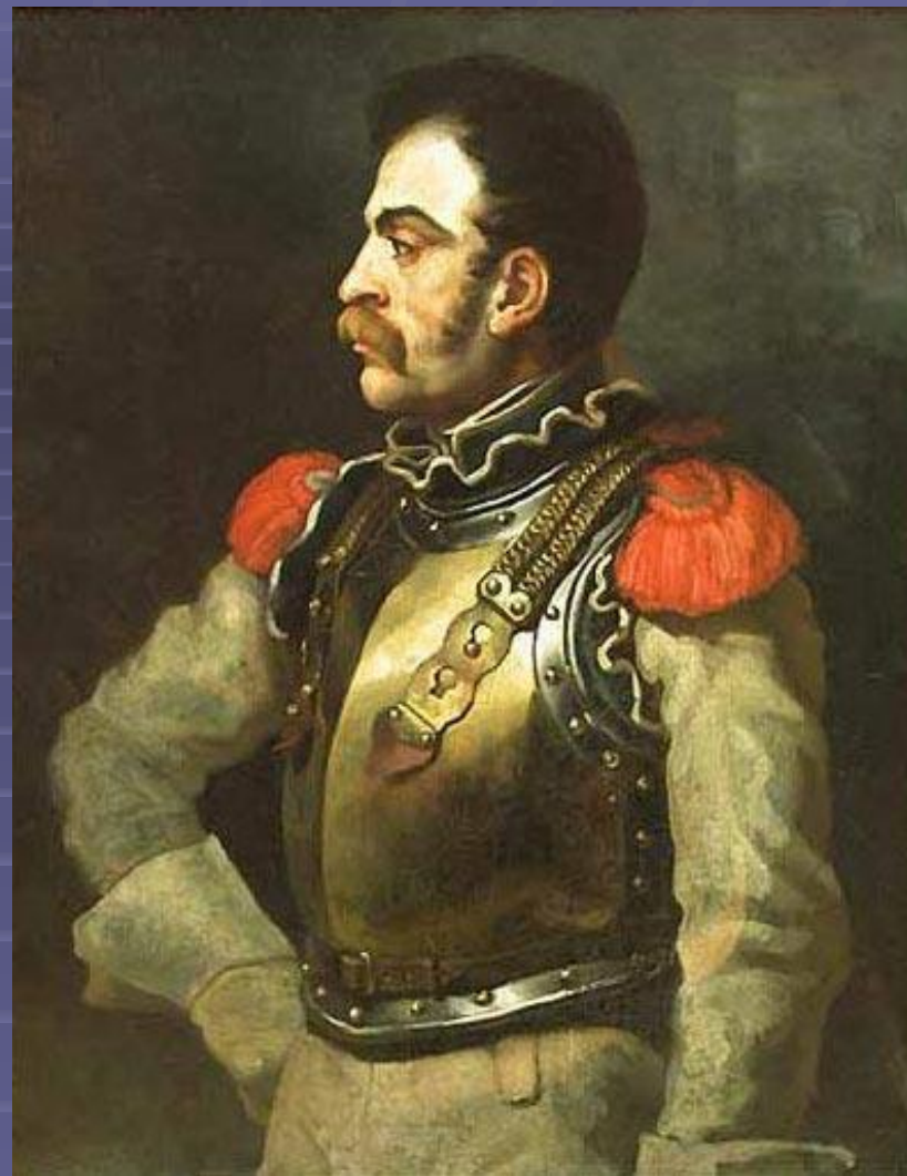
"Портрет офицера" 1814, Лувр, Париж, Франция