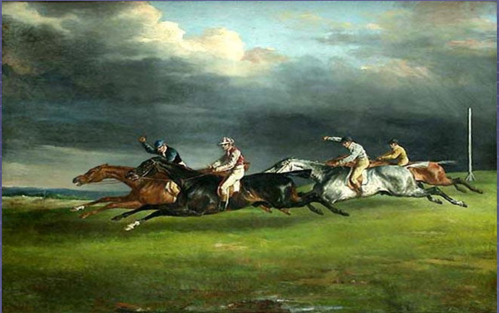
"Дерби 1821 года в Эпсоме» 1821, Лувр, Париж