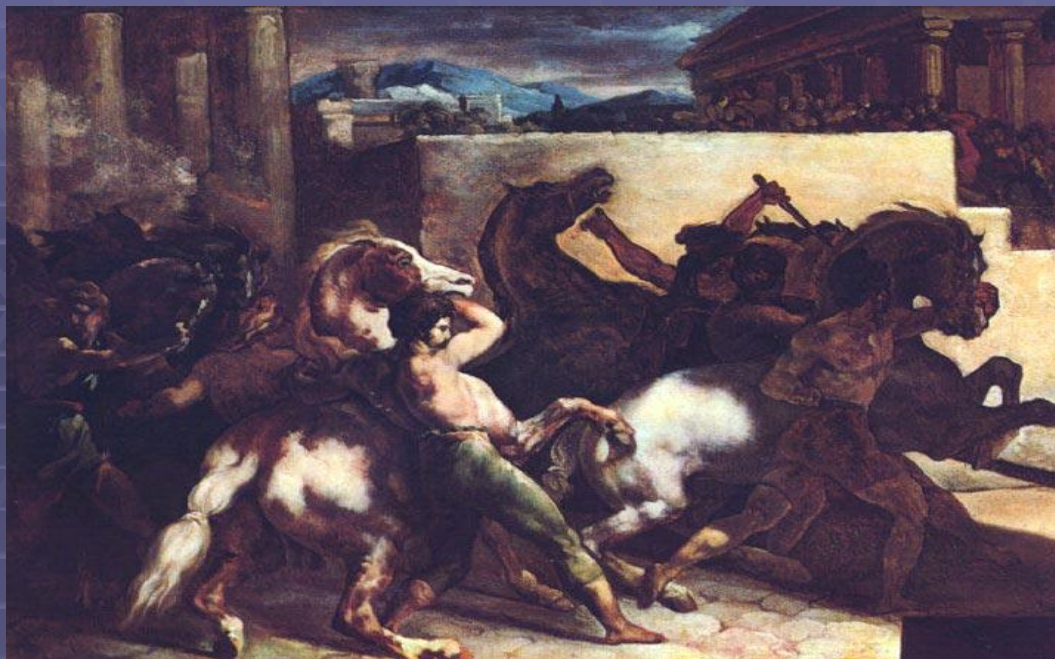
"Дикие лошади» 1817