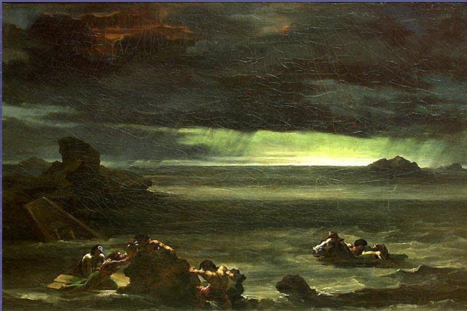
"Сцена кораблекрушения» 1820, Лувр, Париж