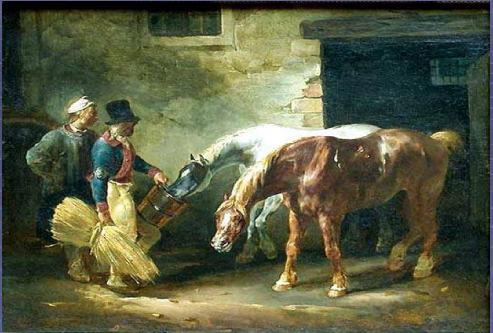
"Две почтовые лошади» 1823