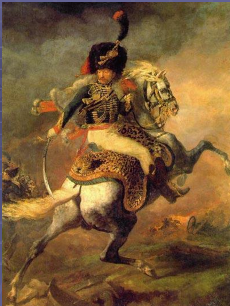
"Офицер конных егерей императорской гвардии, идущий в атаку" 1812, Лувр, Париж