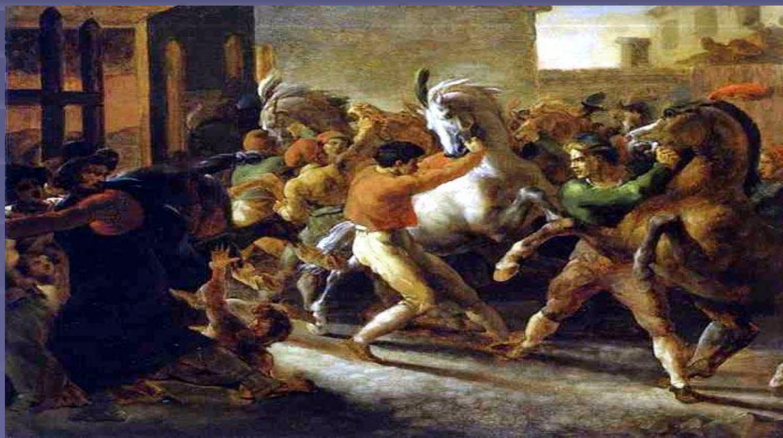
"Бег свободных лошадей в Риме" 1817