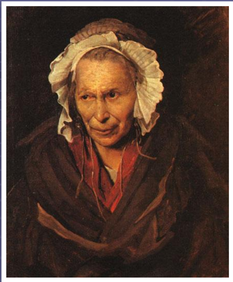
Портрет сумасшедшей, 1822

Представление о художнике-романтике как о свободной, независимой, глубоко эмоциональной личности Жерико выразил в ряде портретов, а истинный гуманизм Теодора Жерико воплощен в объективности серии портретов душевнобольных