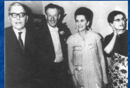
С Д. Шостаковичем

Бриттен никогда не был популярен в России. Однако тонкие музыканты, такие как Дмитрий Шостакович или Святослав Рихтер, дружившие с композитором, знали настоящую цену его таланта. Сейчас в России выпущены диски с музыкой композитора, прочитаны лекции, опубликованы научные статьи. Композитор написал 15 опер, столь же значимых для англичан, как для нас оперы Чайковского и Глинки. А некоторые из них -- "Питер Граймс" или "Поворот винта" -- стали уже оперной классикой.