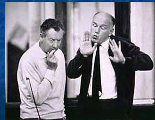
Со С. Рихтером