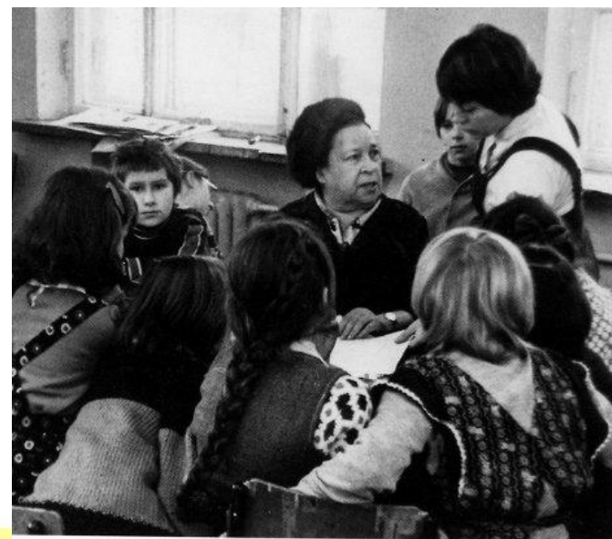
Агния Барто с учащимися школы. 1978 г.