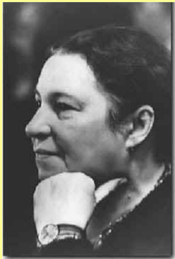
Агния Львовна Барто