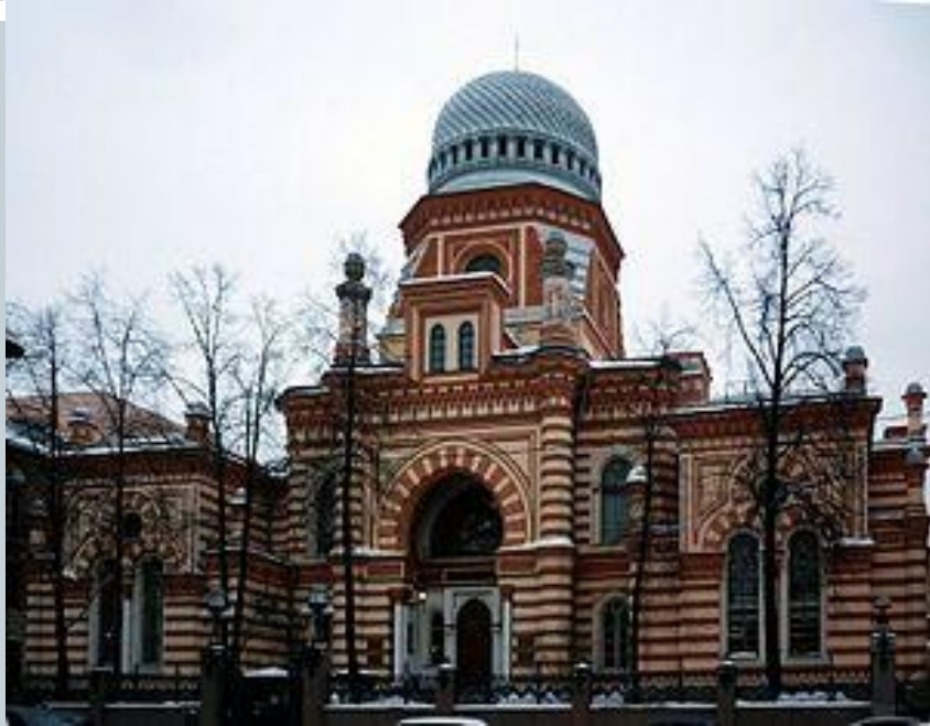
СИНАГОГА В САНКТ- ПЕТЕРБУРГЕ