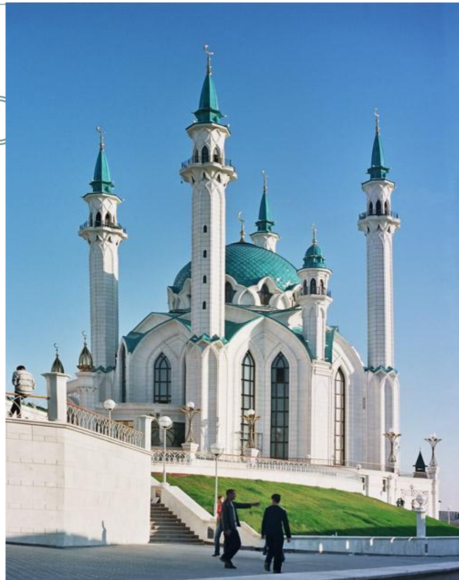
Мечеть Кул Шариф