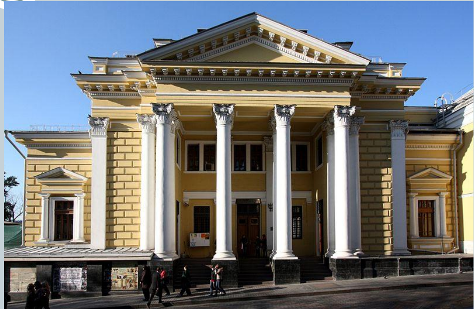
СИНАГОГА В МОСКВЕ