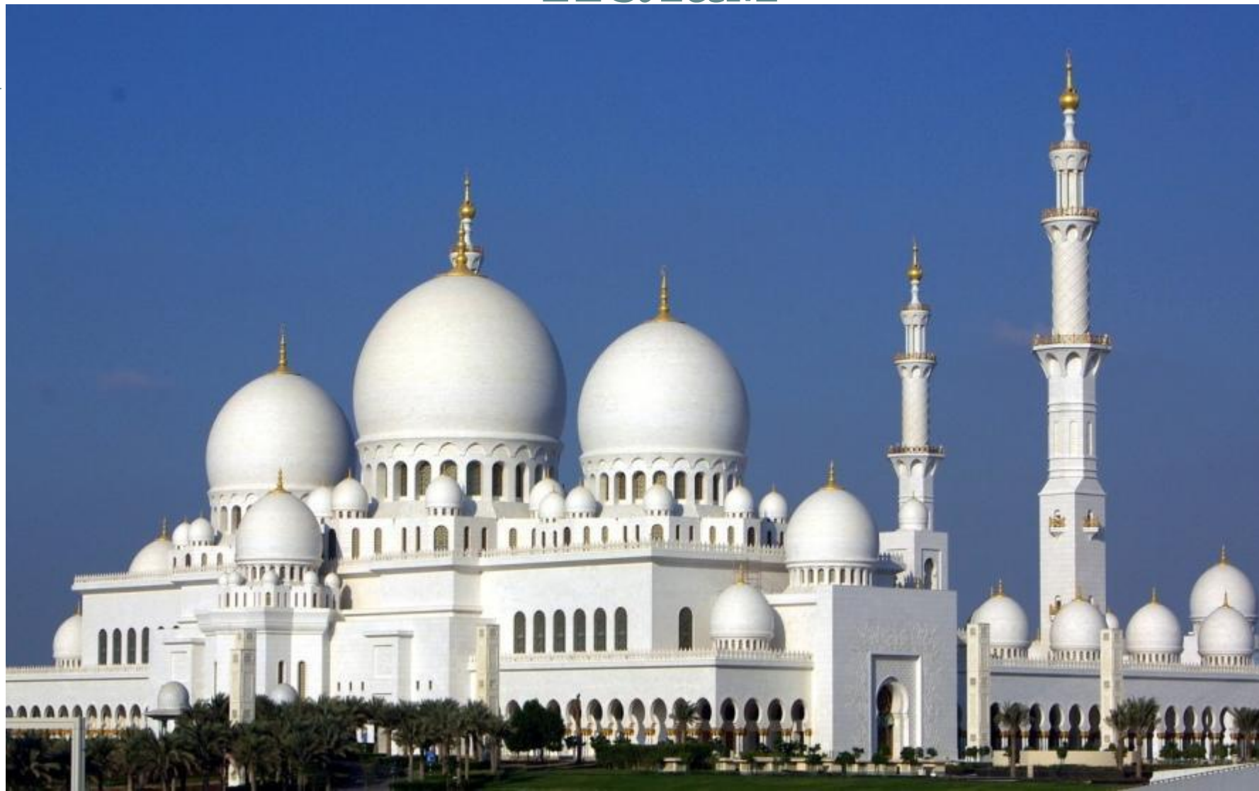
Мечеть шейха Зайда в Абу-Даби