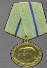
Медаль «Партизану Отечественн ой Войны 2 степени»