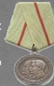
Медаль «Партизану Отечественно й Войны 1 степени»