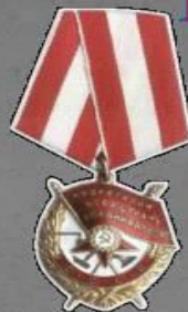
Орден Боевого Красного знамени