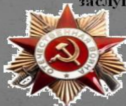
Орден Отечественной Войны 1 степени