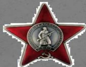
Орден Красной звезды