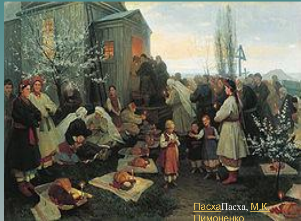
Пасха Пасха, М.К. Пимоненко