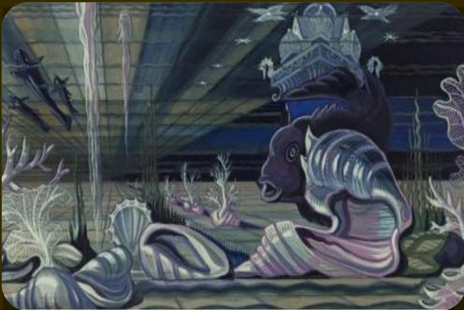
Эскиз декораций к опере «Садко»