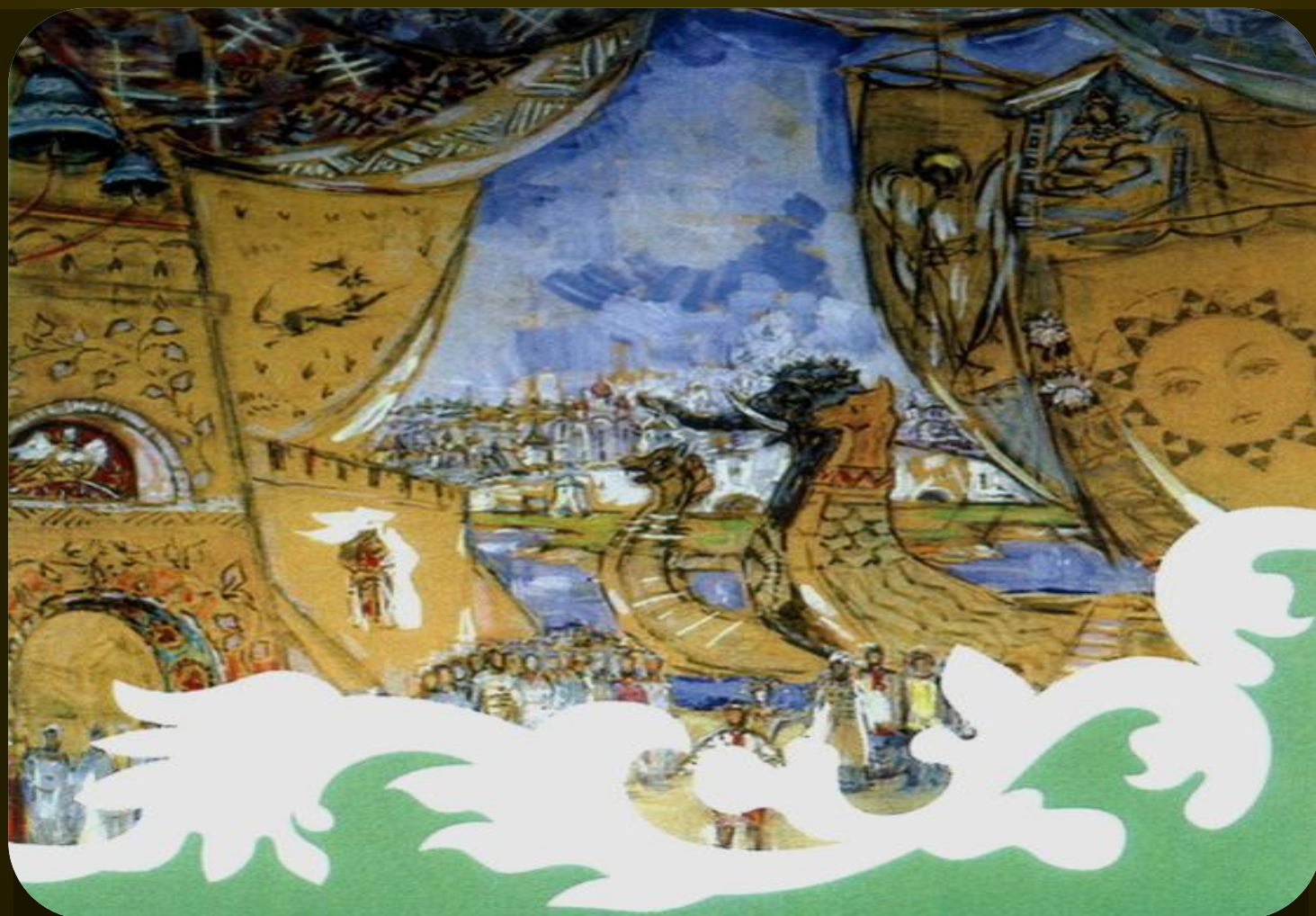
Эскиз декораций к опере «Садко»