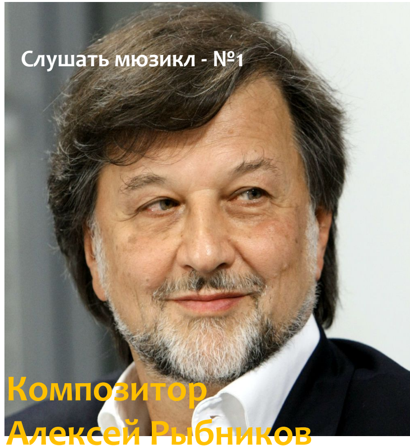
Композитор Алексей Рыбников

Смотреть мультфильм. Как посмотреть – смотрите на следующем слайде