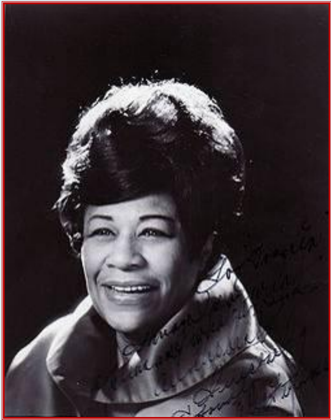
Элла Фицджералд (1917 – 1996)

Американская джазовая певица, известная также как «Леди Элла» и «Первая леди песни» . Обладательница голоса диапазоном в три октавы, Фицджералд считается одной из величайших вокалисток в истории джаза. По крайней мере, никто не мог превзойти её в мастерском владении техникой голосовой импровизации — пение скэтом .