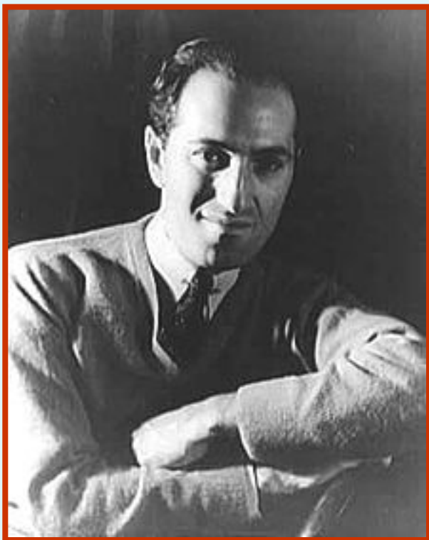
Джордж Гершвин (1898 – 1937)