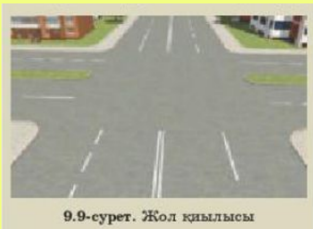
9.9-сурет. Жол қиылысы

ЖЖҚ-ға сәйкес, теміржол өтпелеріндегі жабық шлагбаум жанында немесе түзілген кептеліс нәтижесінде болған жағдаяттар аялдау және тоқтап тұру түсінігіне жатпайды .