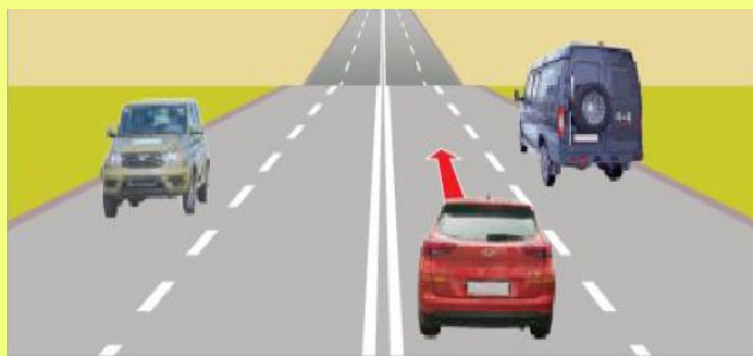
9.6-сурет. Алға озу

Аялдау көлік құралының қозғалысын бес минутқа дейінгі мерзімге әдейі тоқтату. Бұл уақыт жолаушыларды отырғызу мен және түсірумен, көлік құралына жүк тиеумен немесе жүк түсірумен байланысты болса, көбірек те болуы мүмкін.