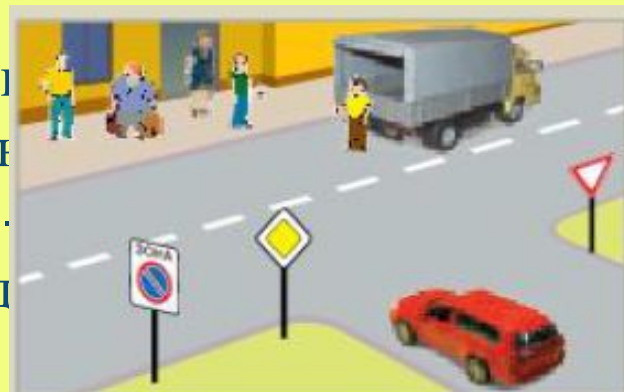
9.8-сурет. Аялдау немесе тоқтап тұру

Тоқтап тұру аялдаудан ұзақтығымен (бес минуттан көп), сондай-ақ жүктеу - жүк түсіру жұмыстарының немесе жолаушыларды отырғызу - түсірудің жоқтығымен де ерекшеленеді. Кейбір жағдайда тоқтап тұруға тыйым салынған жерлерде аялдауға болады.