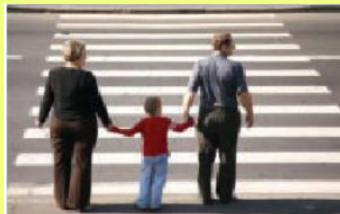
9.2-сурет. Жаяу жүргінші

Жолаушы көлік құралының үстінде (ішінде) отыратын және оны басқармайтын адам.