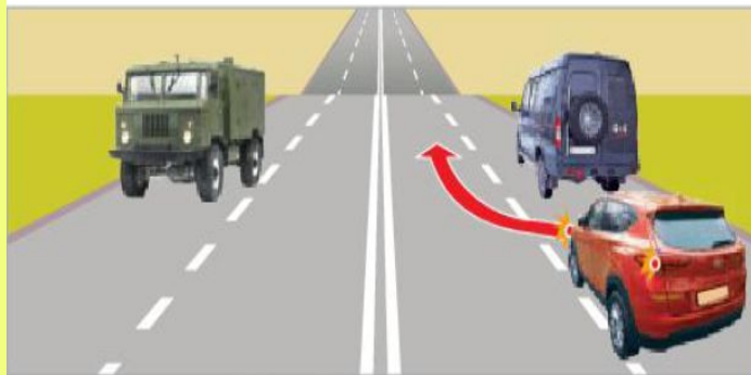
9.7-сурет. Екінші қатарға ауысу