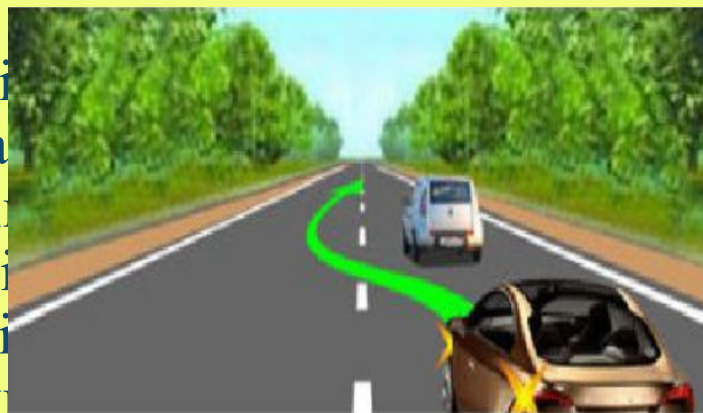
9.5-сурет. Басып озу

Басып озу. Әр жылдары «басып озу» түсінігі әртүрлі түсіндіріліп келді. Қазір «басып озу» түсінігі жүріп келе жатқан жолақтан шығып кету, алдында жүріп келе жатқан бір немесе бірнеше көлік құралынан озу және бұдан кейін алдыңғы жүрген жолаққа қайтып оралумен байланысты маневр ретінде түсіндіріледі.