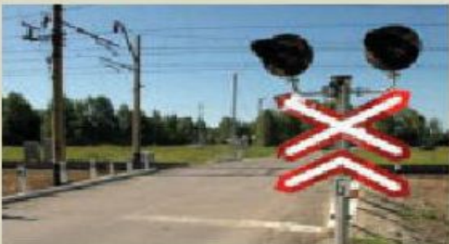
9.12-сурет. Теміржол өтпесі