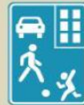
9.15-сурет. 5.38 Тұрғын аймақ

Тұрғын аймақ - 5.38 белгісімен белгіленген, тұру үшін пайдаланылатын елді мекеннің аумағы.