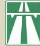
9.14-сурет. 5.1 Автомагистраль

- автомагистраль ретінде арнаулы белгілермен белгіленуі. .