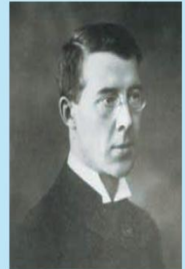
Сорокин Питирим (1889-1968).

Русско-американский социолог и культуролог.