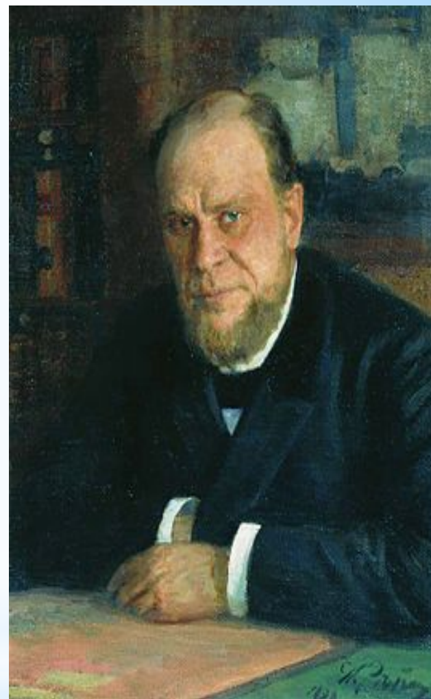
Анатолий Федорович Кони

Осындай адамдар қатарына Анатолий Федорович Кони да жатады. Оның 150 жасқа толған күні 1994 жылы атап өтілді. Ол кісі өз қызметін Петербургта жәй төрешінің қатынасынан бастап, жоғарғы төрешіге дейін қызмет атқара жүріп, сот процестерінің жұмысы жөніндегі бірнеше жазбалар шығарған – А.Ф.Кони өз ісінің білгір маманы болып танылды. Ол кісі сот процесінде – сол сотқа қатысып отырғандарға, әсіресе, прокурорларға ұстамдылықты, жинақы болуды, сыпайыгершілікпен қарау арқылы заңды қатаң ұстауды талап еткен.