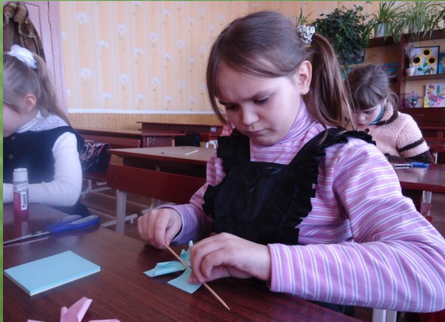
Виготовлення квітів із паперу