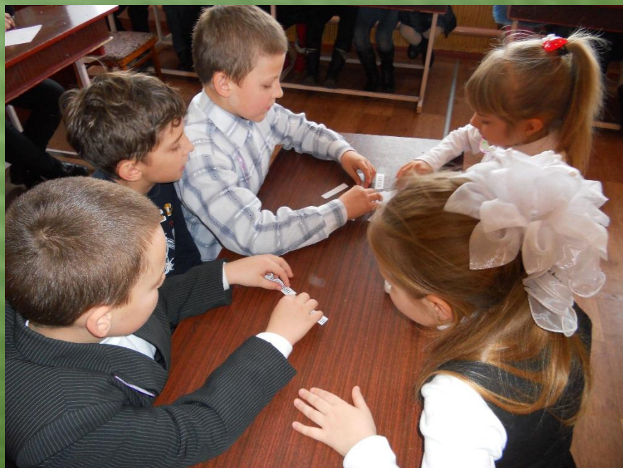
Обговорення правил поведінки біля водойм