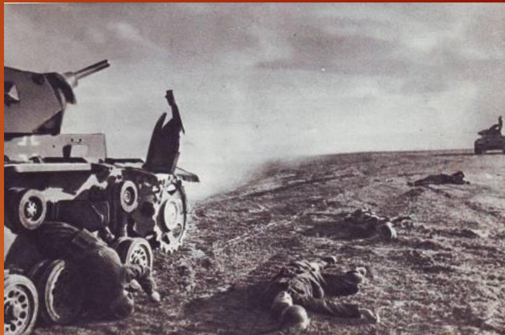
Атака немецких танков отбита