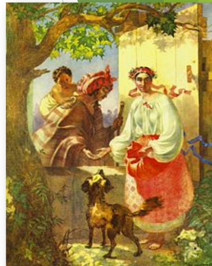
Тарас Шевченко. Циганка-ворожка. 1841р.