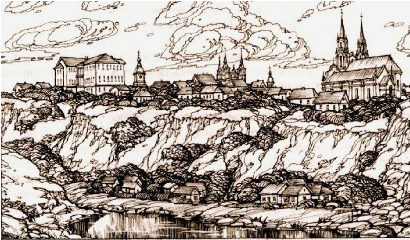
Панорама Замкової гори. Ліворуч — Королівський палац. Реконструкція В. Олійника.

На Замковій горі в Житомирі у XIV - XVIII століттях була розташована фортеця. Зруйнована у 1769 році російськими гусарами і донськими козаками.