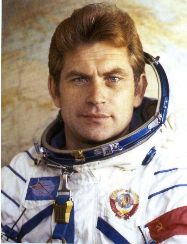
В. Коваленок незадолго до первого космического полета

С 9 по 11 октября 1977 года совершил свой первый полёт в космос на космическом корабле «Союз-25» (позывной «Фотон-1») в качестве командира корабля. По программе полёта «Союз-25» должен был состыковаться со станцией «Салют-6», но из-за нештатного режима работы системы сближения стыковку осуществить не удалось и полёт был досрочно прекращён. Общая продолжительность первого пребывания в космосе составила 2 дня 44 минуты и 45 секунд.