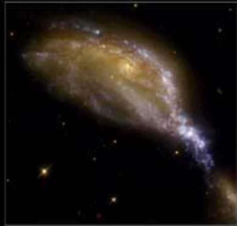
Interacting Galaxy System NGC 6745

То, что похоже на голову птицы, наклонившейся над пищей, является результатом столкновения галактик: большой спиральной, чье ядро не затронуто и маленькой, находящейся в нижнем правом углу снимка. Галактики не просто гравитационно взаимодействуют - они действительно перенесли столкновение. Когда сталкиваются галактики, со звездами ничего не происходит - вероятность их столкновения ничтожна и они свободно пролетают сквозь чужую галактику. Зато межзвездная среда (газ пыль и магнитное поле) испытывает настоящее столкновение со сжатием и ударными волнами. Ударное сжатие, дает старт дальнейшему сжатию облаков межзвездной среды под действием собственного тяготения и, в конечном счете, образованию звезд.