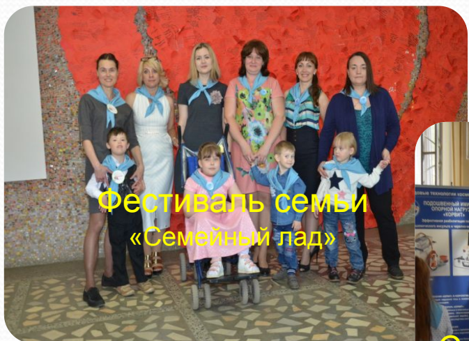
Фестиваль семьи «Семейный лад»

Наша организация активно участвует в общественных мероприятиях, направленных на формирование новых методов взаимодействия органов государственной власти и общественных объединений в сфере поддержки людей с ограниченными физическими возможностями. Результат этого общения - бесценный опыт и укрепление связей с госструктурами.