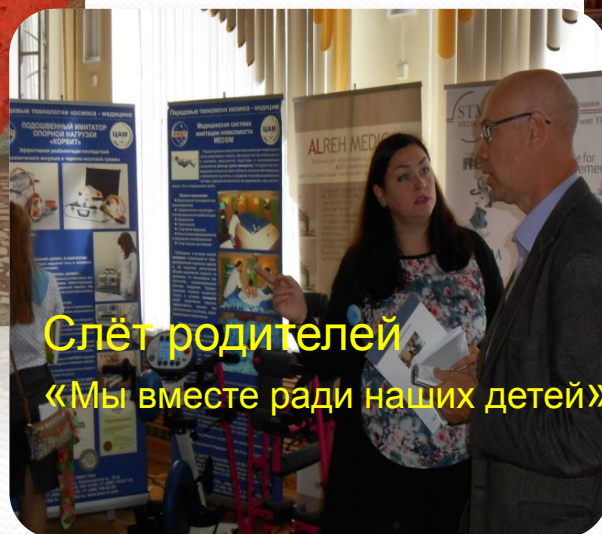
Слёт родителей «Мы вместе ради наших детей»