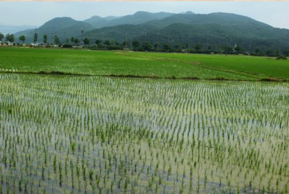
(Рисовые поля в сезон дождей)

Доля сельского хозяйства в ВВП страны составляет всего лишь 3 %. Поэтому можно сказать, что Южная Корея из сельскохозяйственной страны превратилась в промышленную.