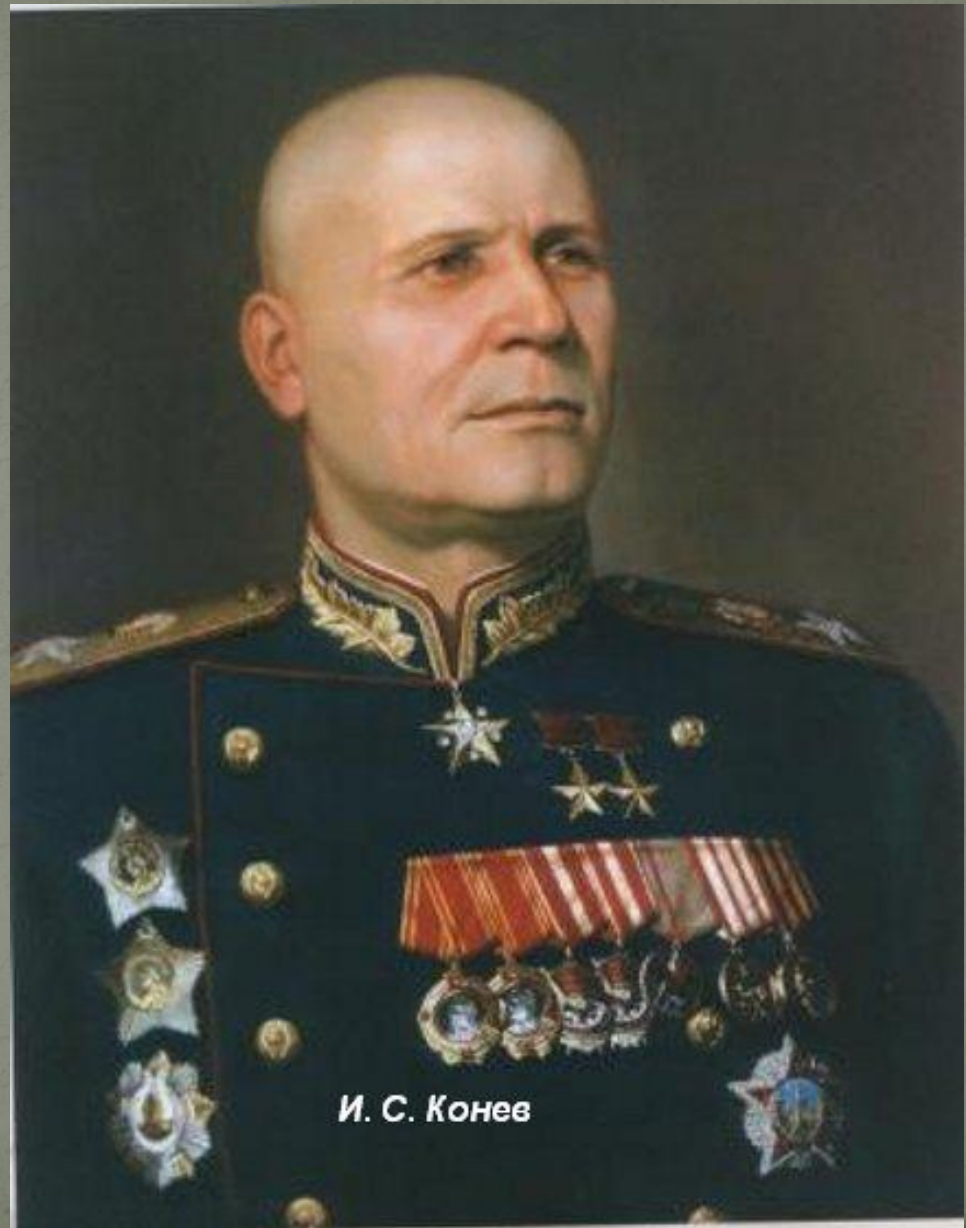
И. С. Конев

в 1956-60 главком ОВС Варшавского договора. Кавалер ордена "Победа".