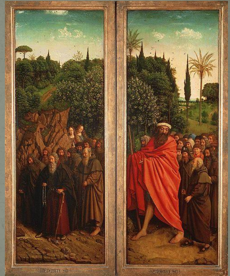
Шествие отшельников и пилигримов