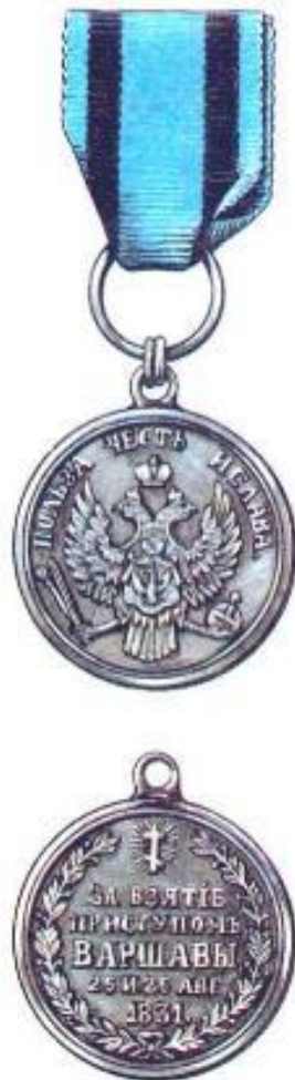
Памятная медаль «За взятие Варшавы»

13.1.1830 Сейм объявил о лишении Николая I права на польский престол.