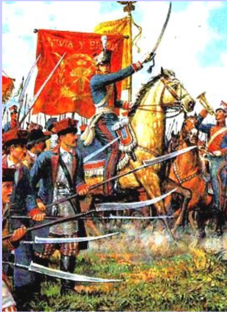
Восставшие на марше

После принятия Конституции 1815 г. поляки ожидали предоставления им независимости, но в н.20-х гг. цесаревич Константин начал проводить насильственную русификацию. В 1830 г. в Польше вспыхнуло восстание. Его поводом стала попытка послать поляков на подавление революции во Франции. Поляки попытались убить Константина и захватили арсенал