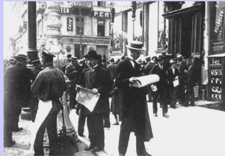
На Невском после объявления войны.