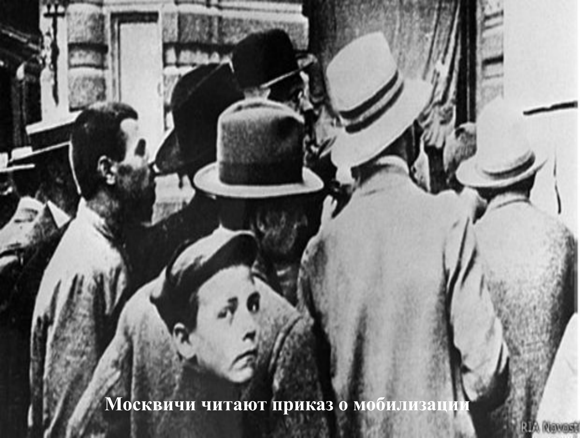
Москвичи читают приказ о мобилизации