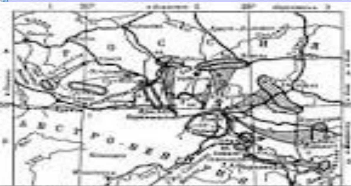
ГАЛИЦИЙСКАЯ БИТВА 1914г. (слева и справа)