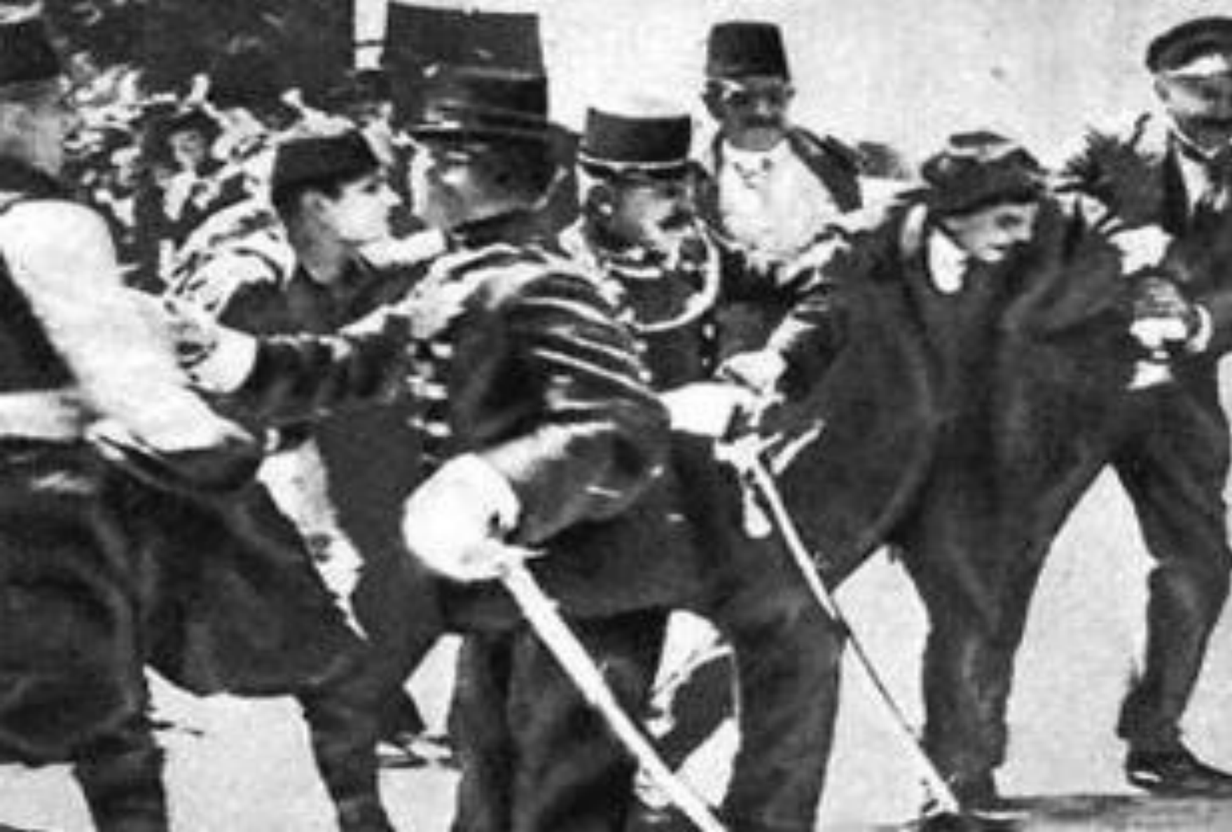
Арест Гавриила Принципа