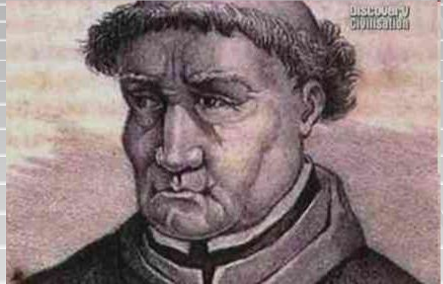
Томас Торквемада – глава испанской инквизиции