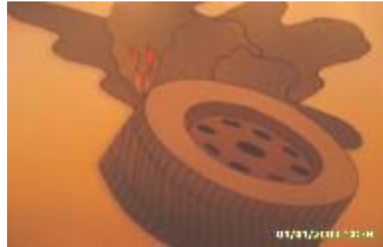
Запах горячей резины