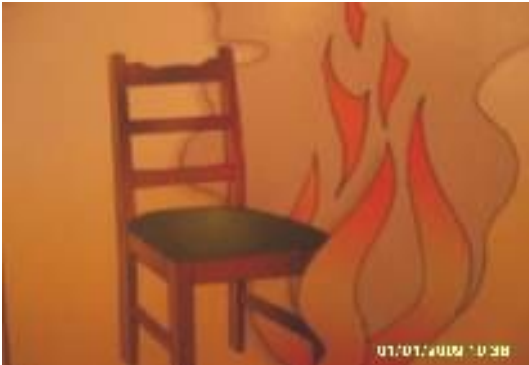
Потрескивание горящих предметов