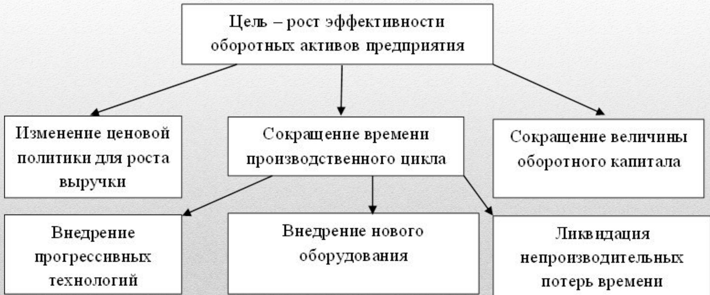
Рисунок 3.1 – Дерево целей роста эффективности оборотного капитала