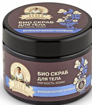
Скраб для тела