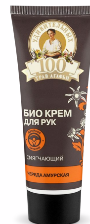
Крем для рук