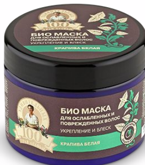
Маска для волос