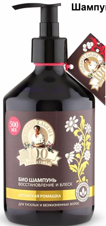
Шампунь для волос