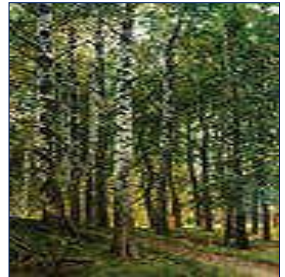
Иван Иванович Шишкин «Берёзовая роща»