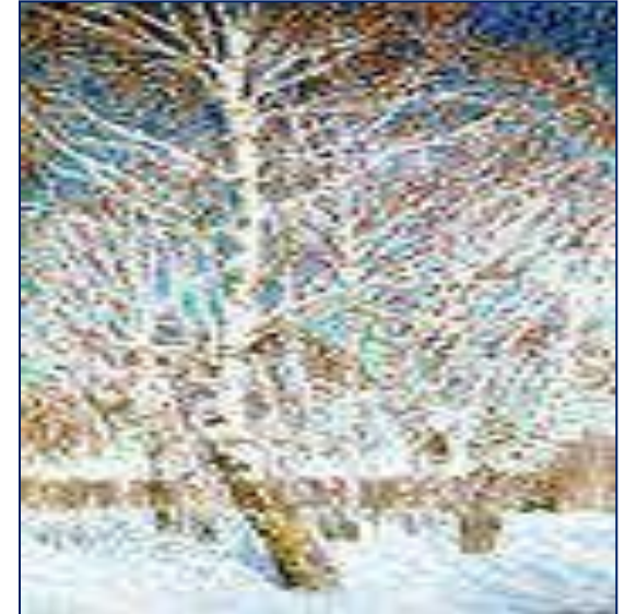
«Февральская лазурь» И.Грабарь