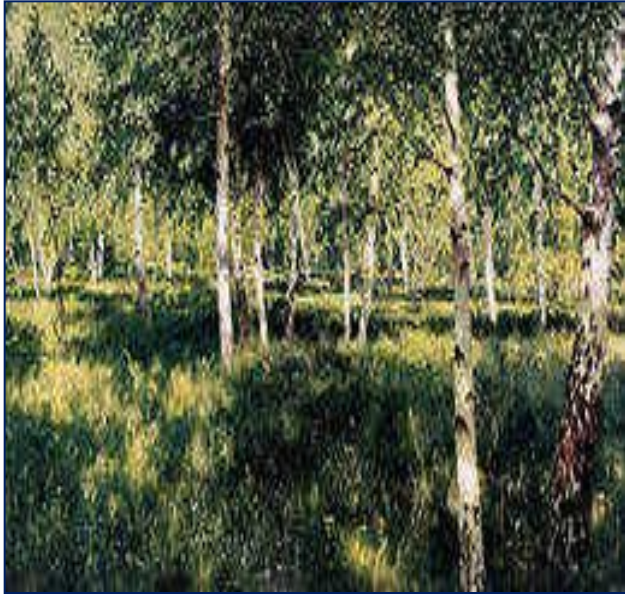
Левитан Исаак «Берёзовая роща»