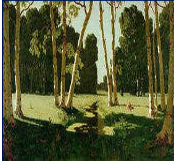
Архип Иванович Куинджи «Берёзовая роща»