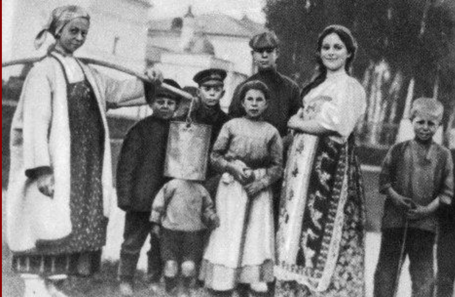
Есенин (третий справа) среди односельчан. 1909 год.