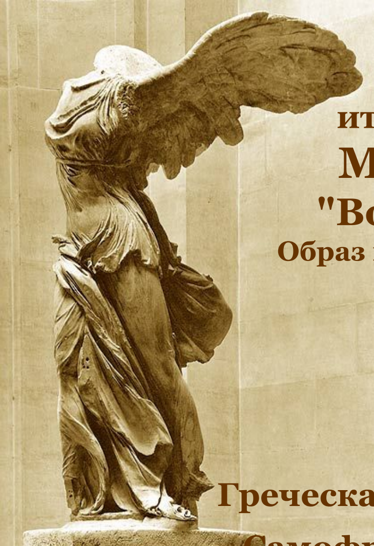
Греческая скульптура Ника Самофракийская -богиня Победы.

Скульптура итальянского мастера Микеланджело - "Восставший раб"... Образ прекрасного и сильного юноши, пытающегося разорвать путы.