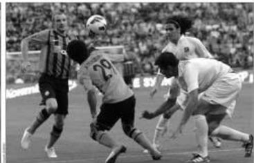
14 жовтня. Київ. «Динамо» - «Шахтар». Д. Д. С. В останні хвилини зустрічі «Динамо» вийшло на поле з повною силою і домінувало в грі.