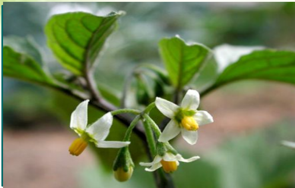
Паслён сладко - горький