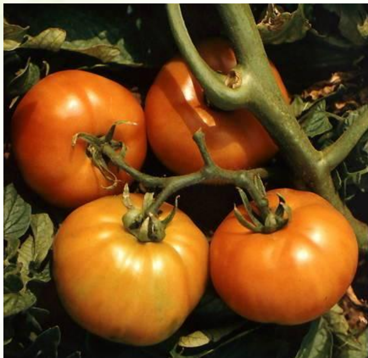
Помидор или томат