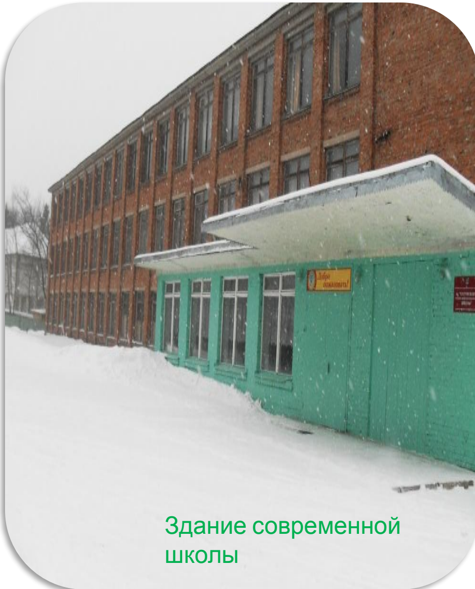
Здание современной школы