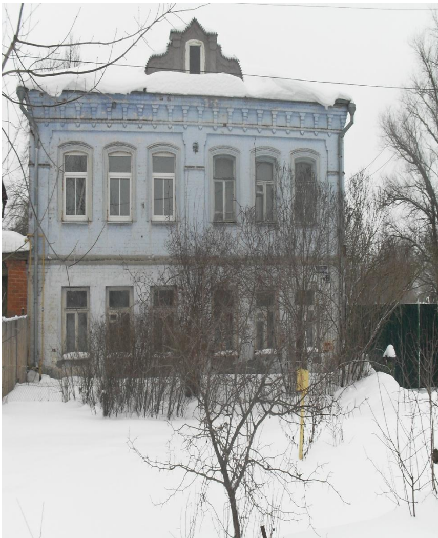
Старинный купеческий дом