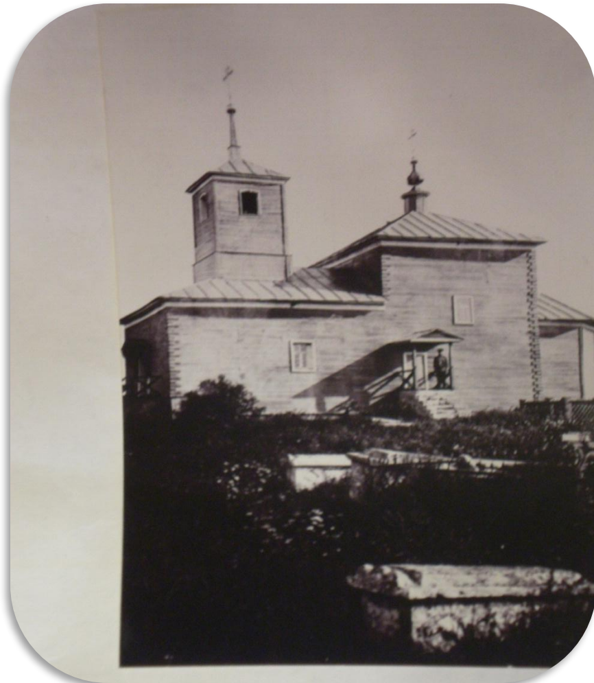
Церковь на старом Городище