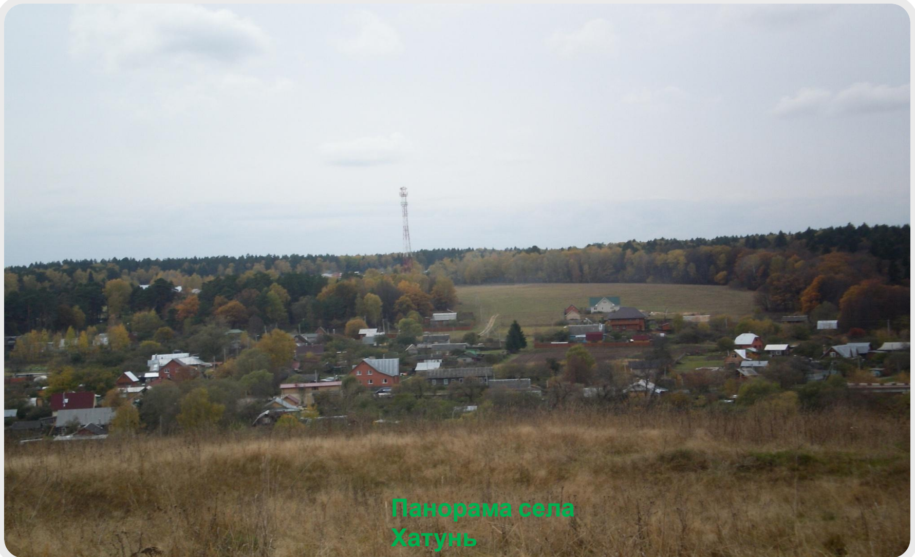
Панорама села Хатунь

Сейчас Хатунь представляет собой небольшое село со своими достижениями и проблемами, но все с теми же пейзажами, красотами и загадками, которые еще предстоит разгадать.