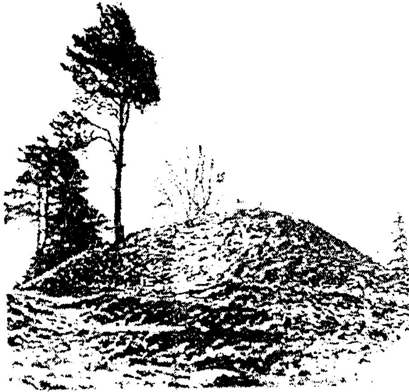
Хатунь. Городище. XII в.

Пройдя через годы, изведав невзгоды, Могла б поседеть ты как лунь, Но людям на счастье стоишь над Лопасней Всегда молодая Хатунь! Струков Е.К.