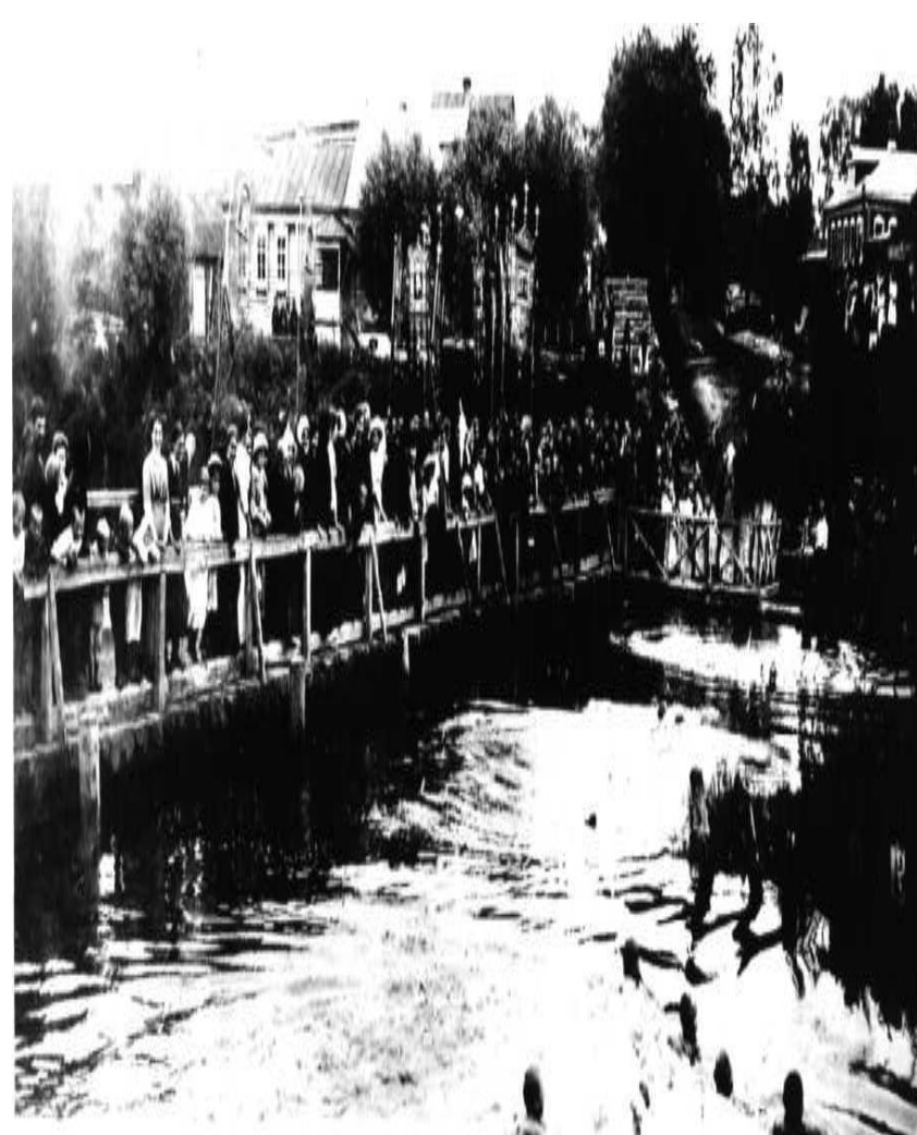
Старый деревянный мост через р. Лопасня