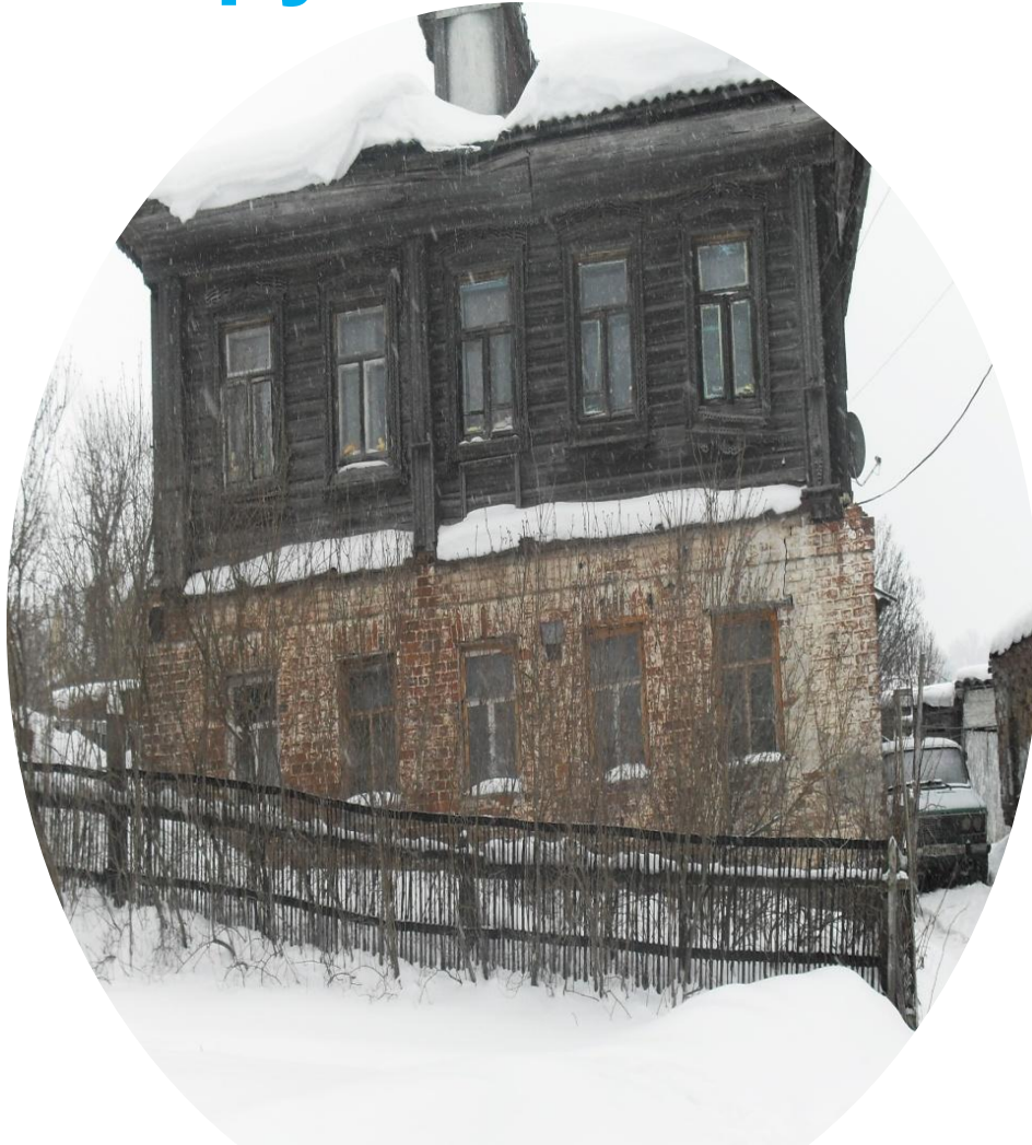
Старинный купеческий дом