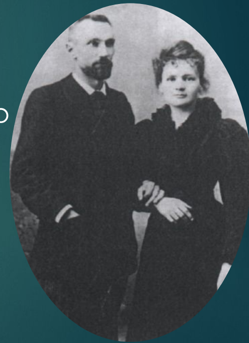
Мария и Пьер Кюри