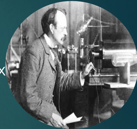
Дж. Дж. Томсон