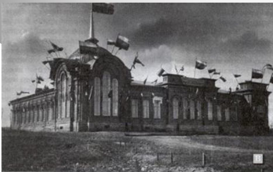
Лечебница им. А. А. Миславского в день открытия. Апрель 1906 года.