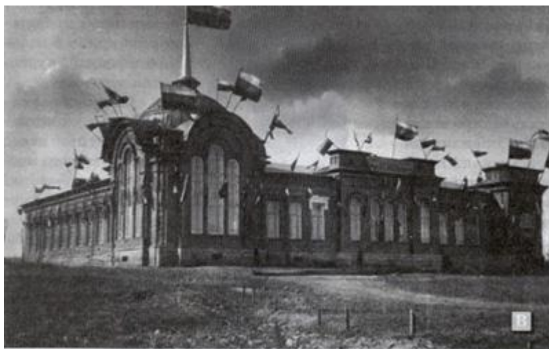
Лечебница им. А. А. Миславского в день открытия. Апрель 1906 года.