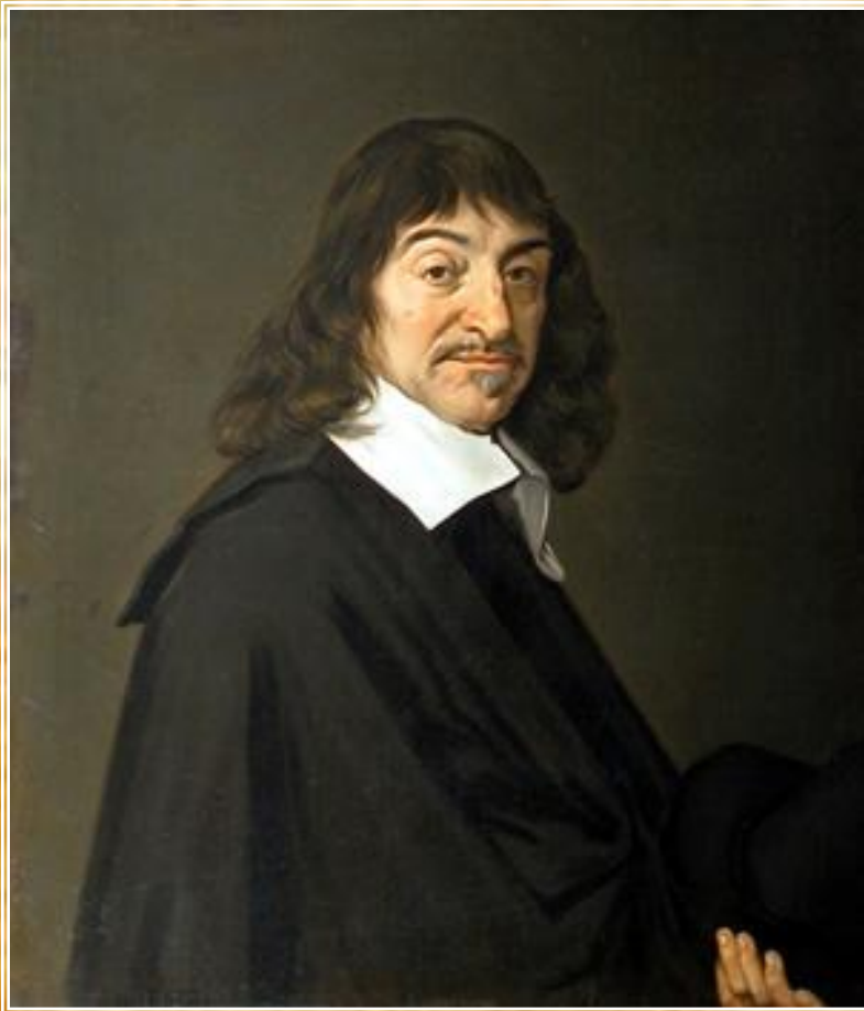
Рене Декарт (копия утраченного портрета работы Ф. Хальса)